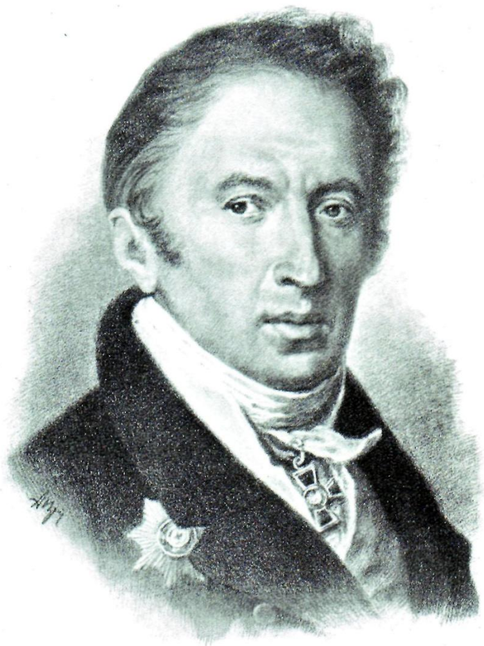
Николай Михайлович КАРАМЗИН (1766—1826)

Интерес к истории был небывалый: читающая Россия ждала завершения огромного труда Н.М. Карамзина об Отечестве. «История государства Российского» — так называлось его многотомное издание, которое не потеряло своего значения и для современности. Власть озаботилась необходимостью воспитания чиновников высшего уровня — в Царском Селе под Петербургом открылся Лицей. Его будут называть пушкинским: Пушкин был лицеистом первого набора.