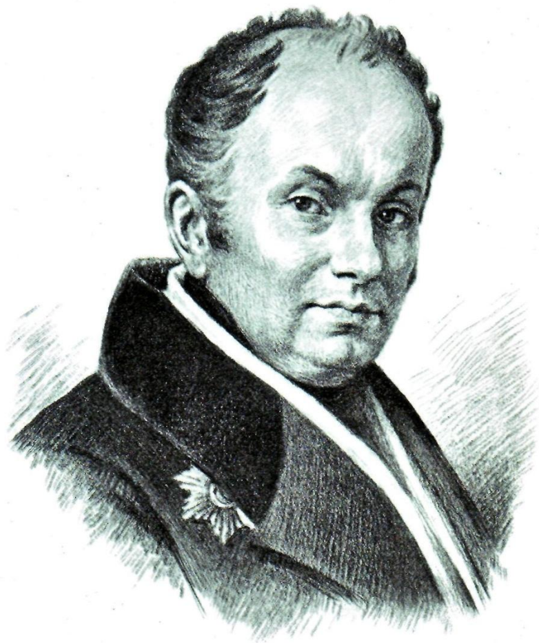
Василий Андреевич ЖУКОВСКИЙ (1783—1852)

После «Руслана и Людмилы» Жуковский надписал Пушкину свою фотографию: «Победителю-ученику от побежденного учителя». Жуковский был рядом с Пушкиным на протяжении почти всей его жизни. Он неоднократно заступался за Пушкина перед царем и находился у постели смертельно раненного поэта в его последней квартире на набережной реки Мойки, в доме 12. Он вывешивал сообщения о состоянии великого поэта.