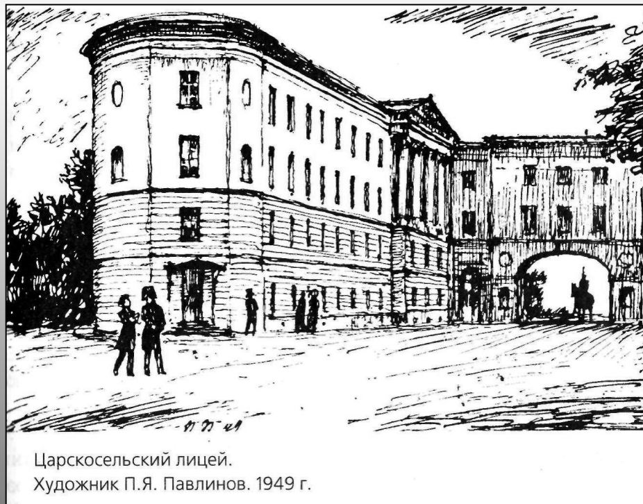
Царскосельский лицей. Художник П.Я. Павлинов. 1949 г.

Спорили о политике и литераторы. В литературных кружках и обществах писатели вели жаркие дискуссии друг с другом — в Обществе любителей российской словесности, «Арзамасе», «Зеленой лампе» — так назывались некоторые из литературных обществ. Возникали новые литературные журналы и альманахи. Книга, журнал стали объектами увлечения и даже моды.