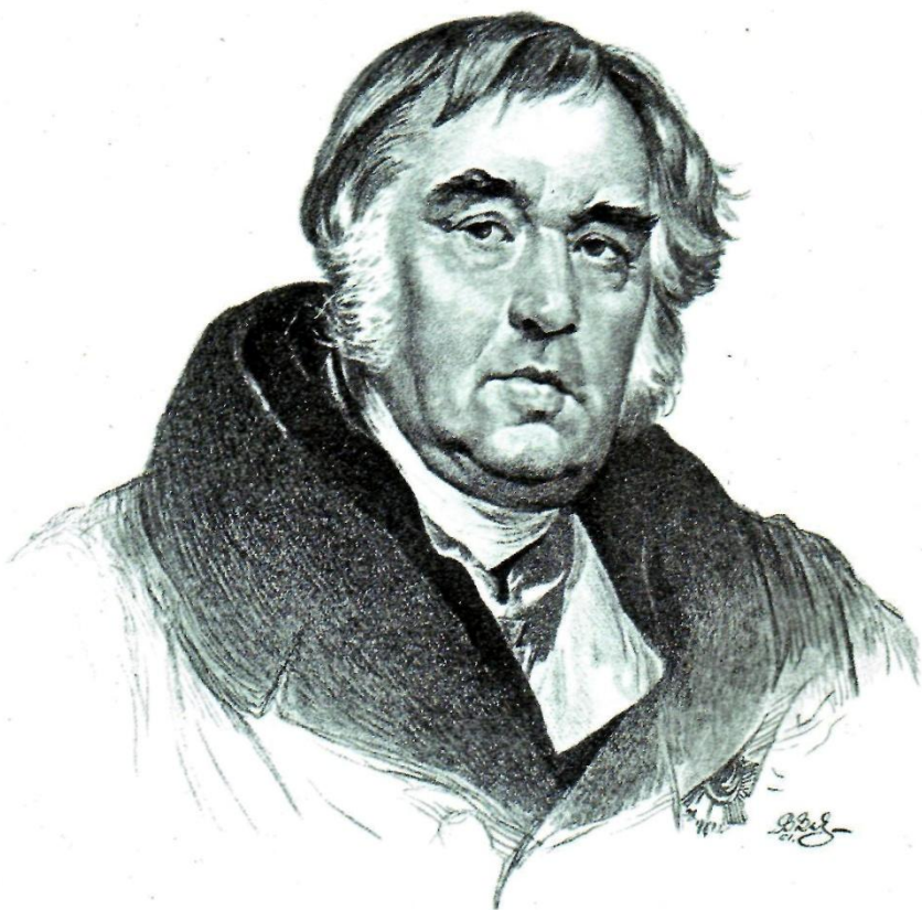
Иван Андреевич КРЫЛОВ (1769—1844)

Вместе с ним юный Тютчев посещал лекции в Московском университете; под руководством учителя он выполнил свой перевод «Послания Горация к Меценату», за что был принят в Общество любителей российской словесности. В своем альманахе «Северная лира» в 1827 году рядом со стихами известных поэтов были опубликованы стихи молодого Ф. Тютчева.