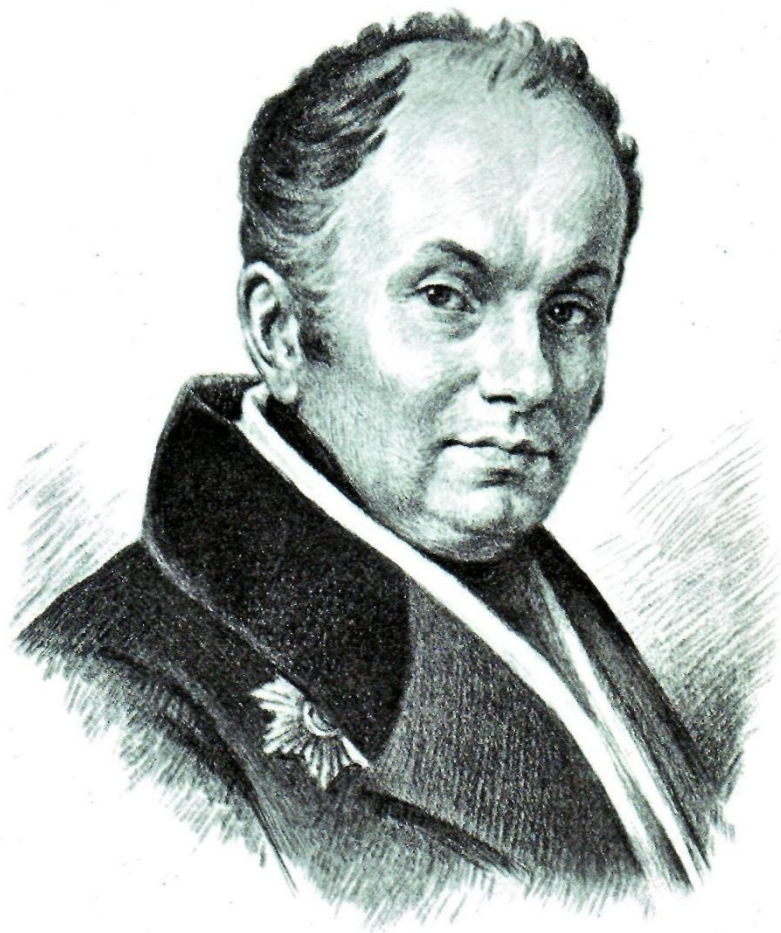
Василий Андреевич ЖУКОВСКИЙ (1783—1852)

После «Руслана и Людмилы» Жуковский надписал Пушкину свою фотографию: «Победителю-ученику от побежденного учителя». Жуковский был рядом с Пушкиным на протяжении почти всей его жизни. Он неоднократно заступался за Пушкина перед царем и находился у постели смертельно раненного поэта в его последней квартире на набережной реки Мойки, в доме 12. Он вывешивал сообщения о состоянии великого поэта.