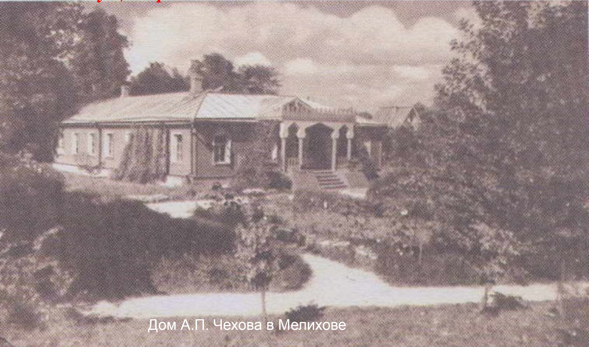
Дом А.П. Чехова в Мелихове

В 1892 году Чехов поселился под Москвой, в деревне Мелихово. Писатель так обосновал свое решение: «Если я врач, то мне нужны больные и больница, если я литератор, то мне нужно жить в гуще народа».