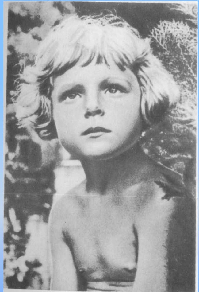
Гуле 3 года