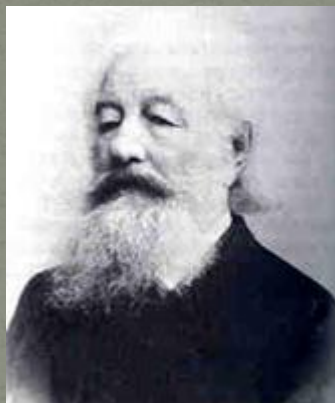
А.Н. Бекетов, дед А.А. Блока. Фотография. 1894 год.