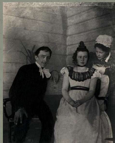
А. Блок в роли Чацкого в любительском спектакле . Боблово. 1898 год.