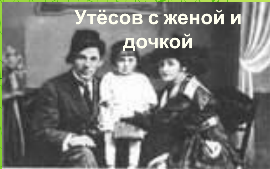
Утёсов с женой и дочкой