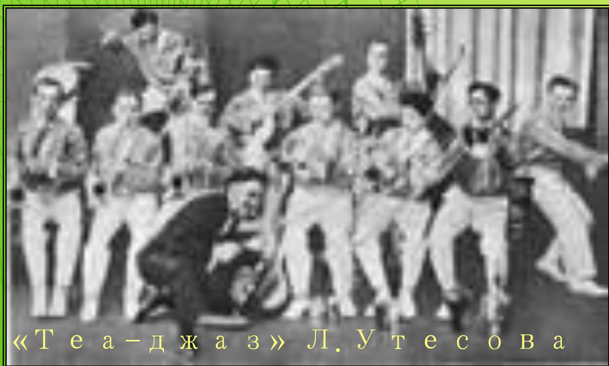
«Т е а - д ж а з» Л. У т е с о в а

собрал музыкантов и стал готовить джазовую программу. 8 марта 1929 года на сцене Малого оперного театра (г. Ленинград) дебютировал театрализованный джаз Леонида Утесова с программой «Теа-джаз».