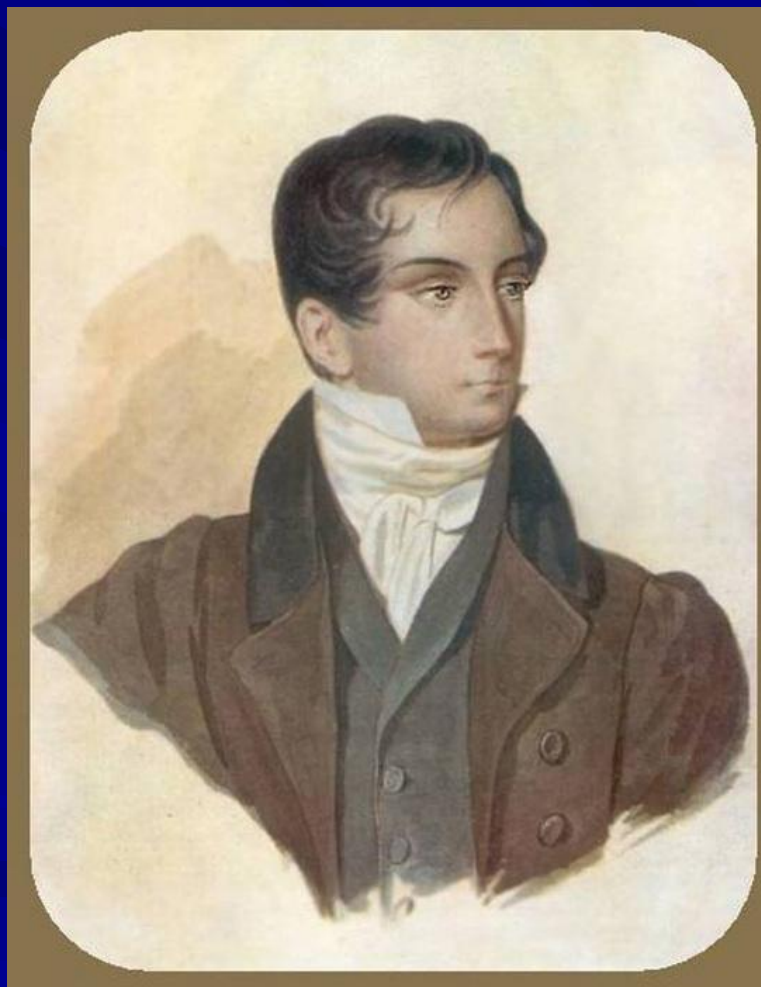
портрет работы А. Агрене 1826 г.