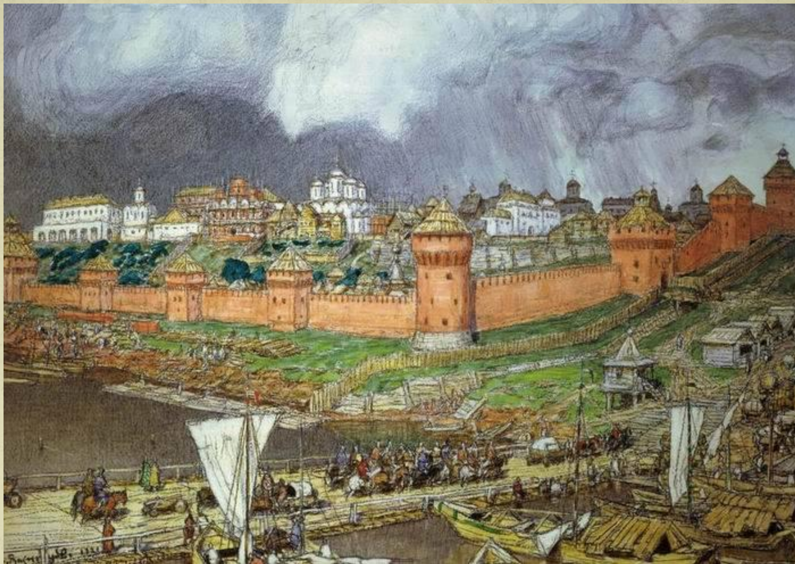
А.М.Васнецов. Кремль, XVI век.