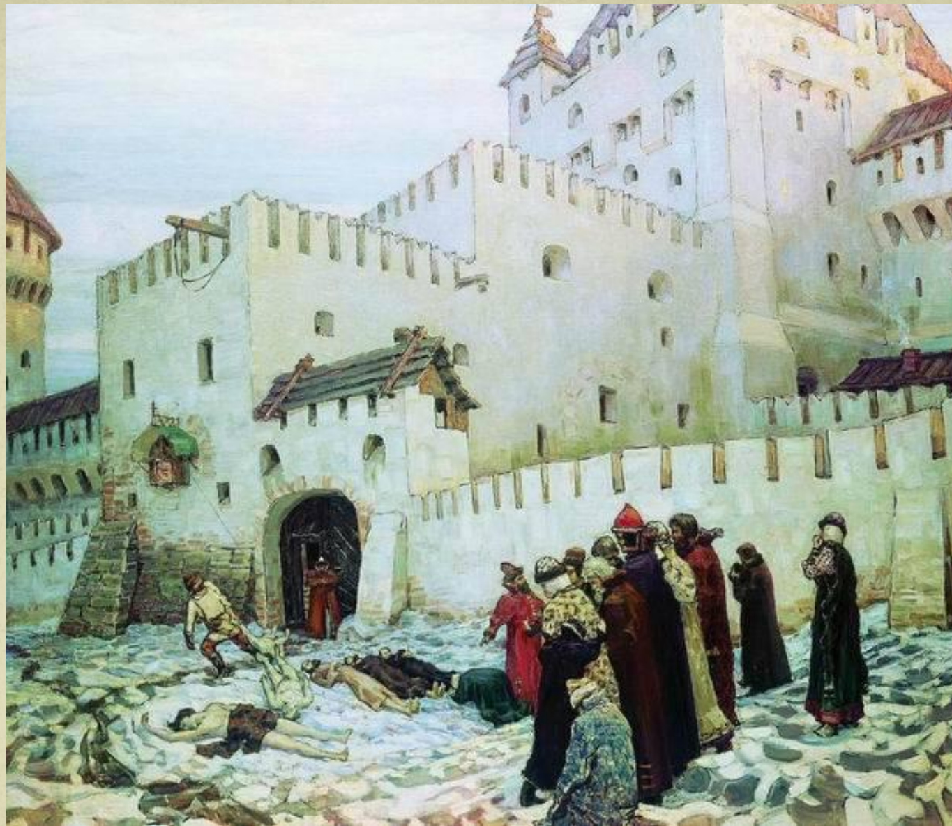
А.М.Васнецов. «Константино-Еленинские Ворота. XVI век.»