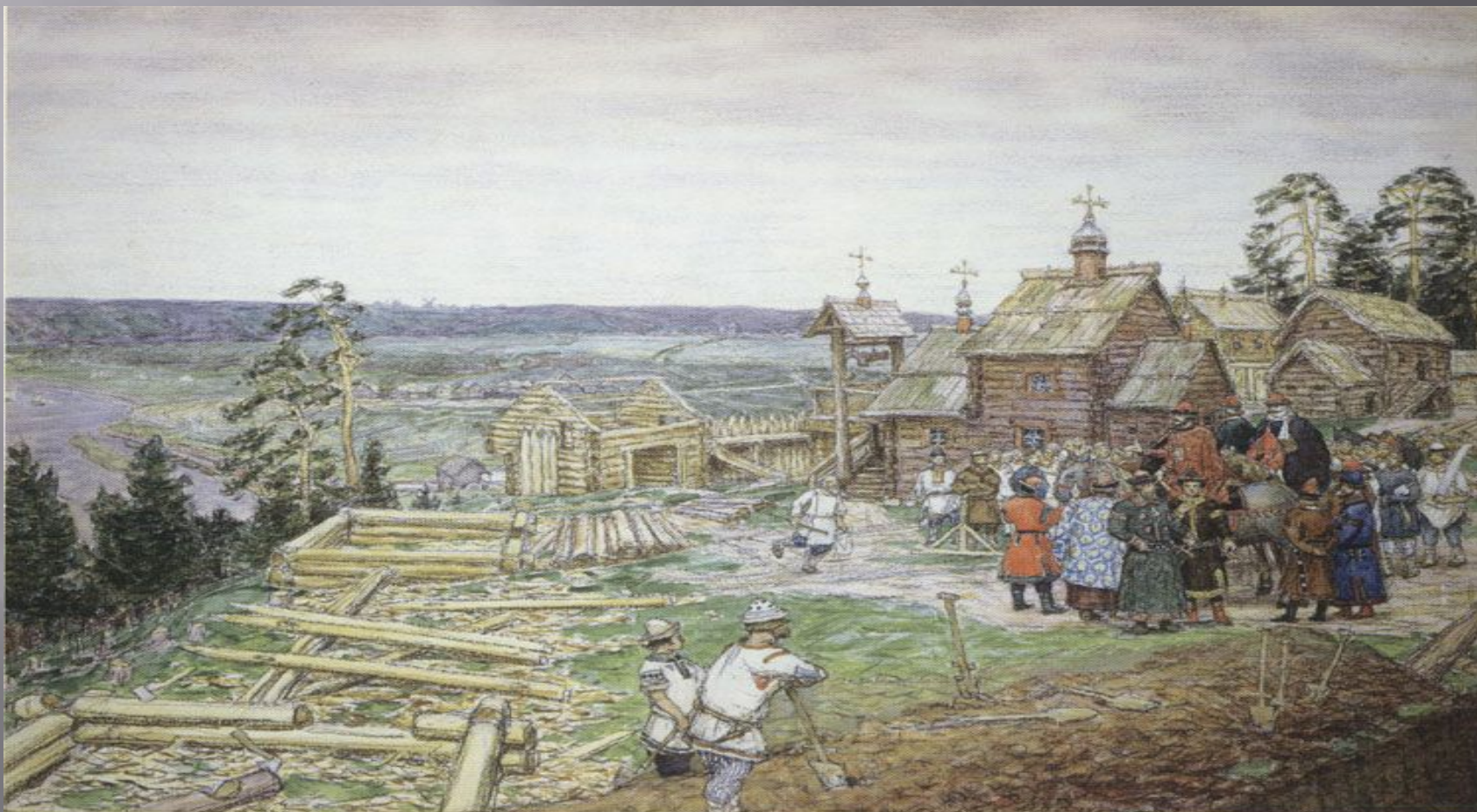
А. ВАСНЕЦОВ Основание Москвы

Слово «город» в древности означало только деревянные или каменные стены.