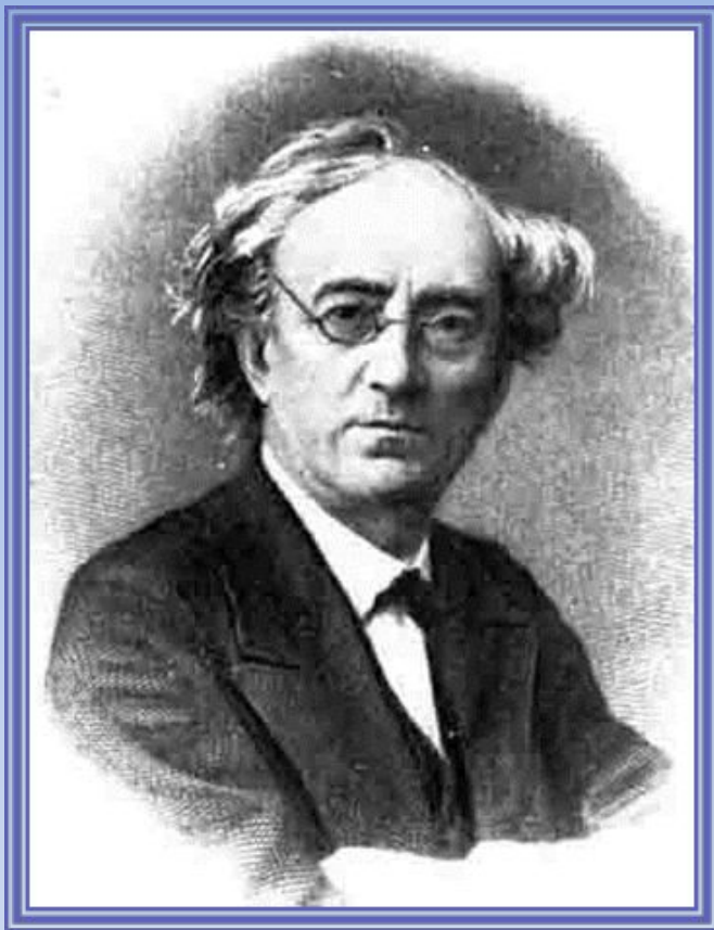
Ф. И. Тютчев