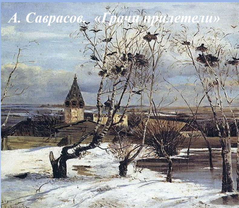
А. Саврасов. «Грачи прилетели»