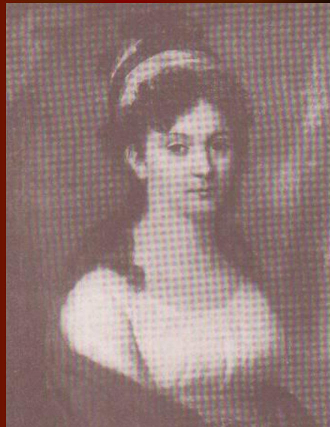
Е.Л.Тютчева, мать поэта