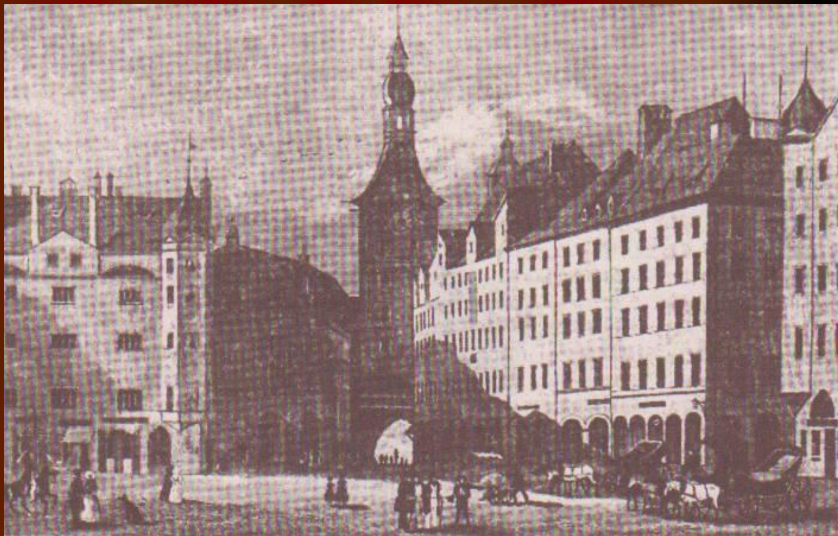
Мюнхен. Городская ратуша