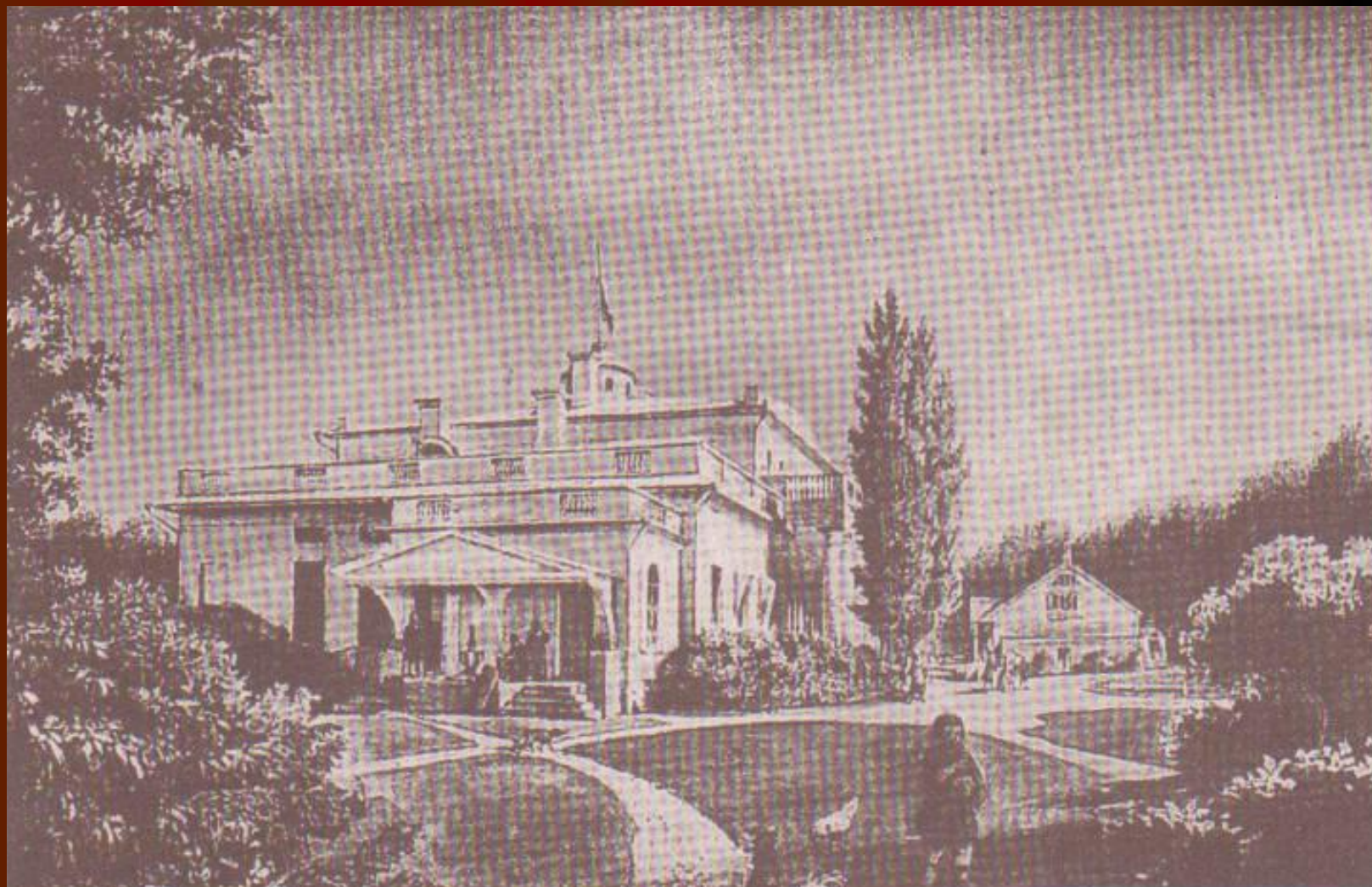
Вид усадьбы Овстуг 1861 год