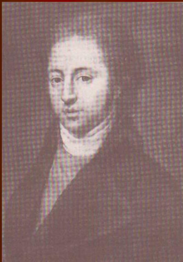
И.Н.Тютчев, отец поэта