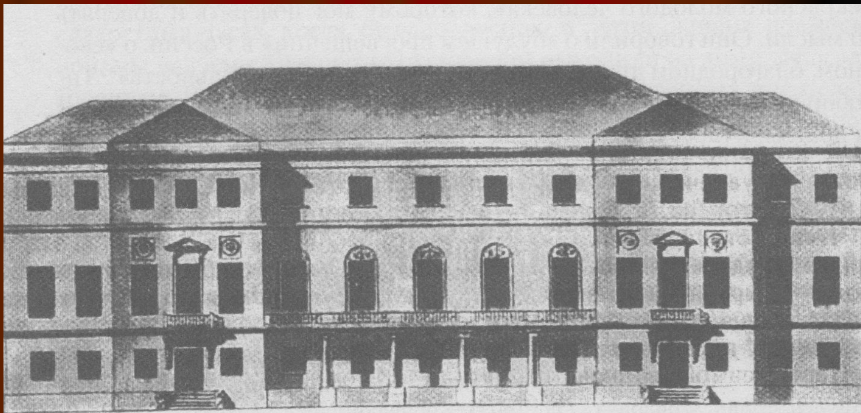
Дом Тютчевых в Москве, в котором Ф.И.Тютчев жил в 1811 – 1822 гг.