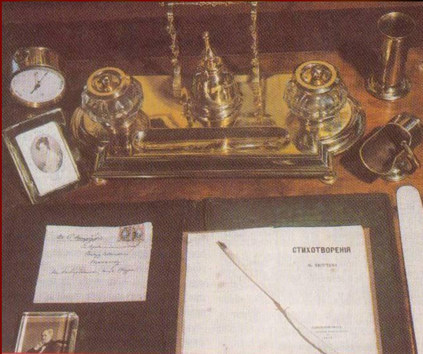
Личные вещи Ф.И.Тютчева. Музей-усадьба Мураново