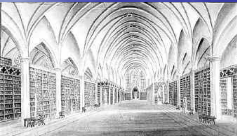
Большой зал библиотеки

В 1813 переезжает в Геттинген и начинает, вместе с братом, преподавательскую деятельность.