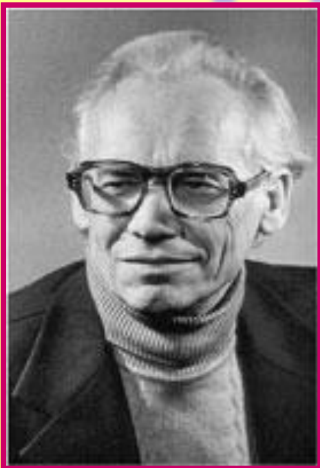
Лев Иванович Кузьмин