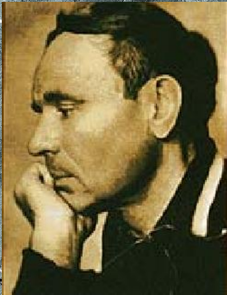
Воробьев Константин Дмитриевич (1919–1975)

Родился 24 сентября 1919 в с. Нижний Реутец Курской области. Окончил сельскую школу-семилетку, курсы киномехаников.