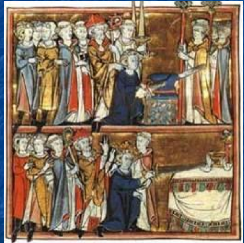
Роман «Артур и Мерлин» 13 в. Артур вытаскивает меч из камня