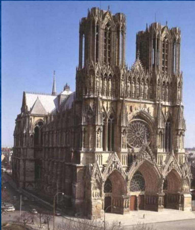
Реймский собор XIII-XV вв.

...Я кроток и смирен сердцем, и найдете покой душам вашим; ибо иго мое благо, и бремя мое легко. Библия новый завет. Евангелие от МАТФЕЯ.-Гл.11