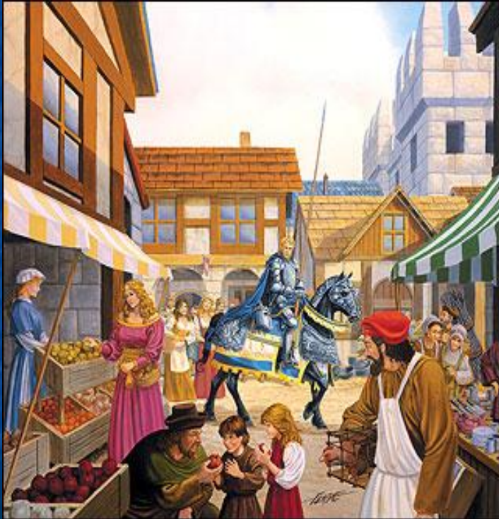
Улица средневекового города XII-XV вв.