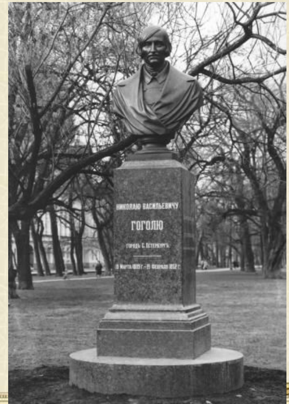
Памятник Н. В. Гоголю в Александровском саду. Ск. В. П. Крейтан