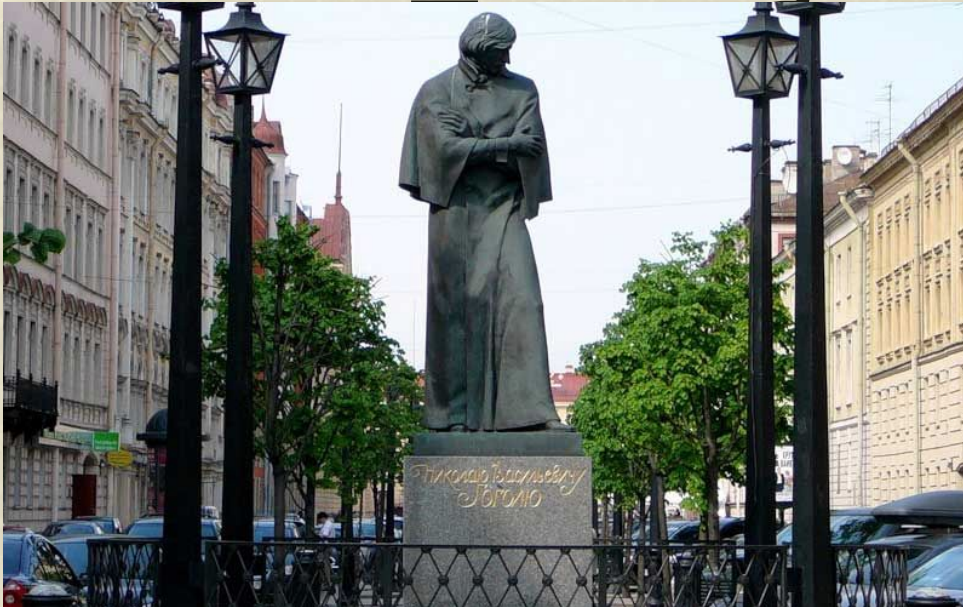
Памятник Н. В. Гоголю на Малой Конюшенной улице. Ск. М. В. Белов