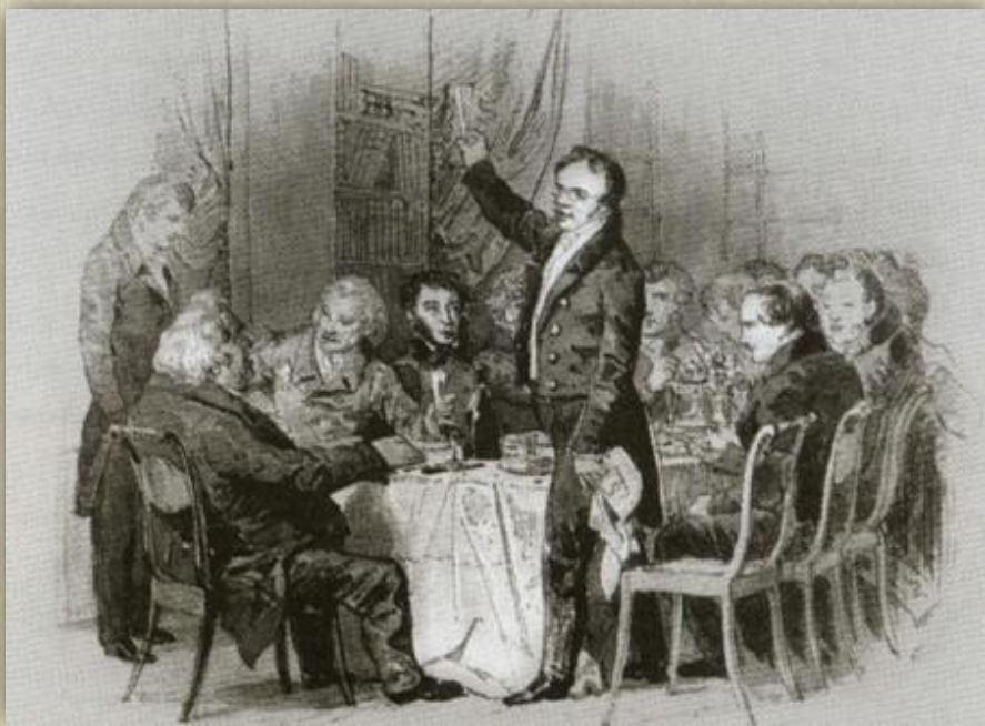
Торжественный обед у А. Ф. Смирдина.