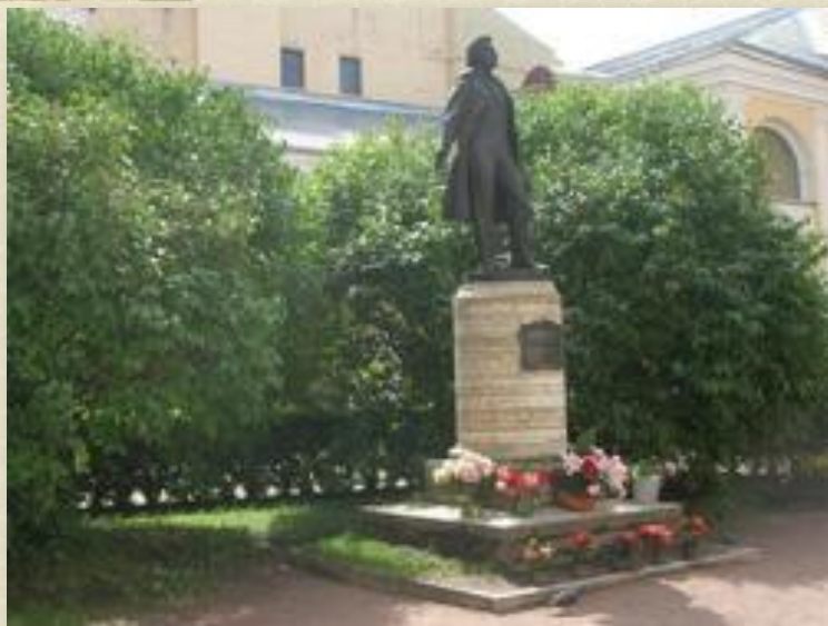
Всероссийский музей Пушкина – Мойка, 12