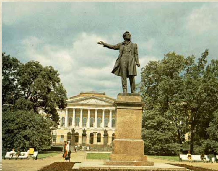
Памятник А.С. Пушкину на площади Искусств. Ск. М. Аникушин