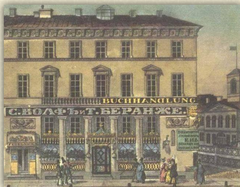
Кондитерская Вольфа и Беранже.