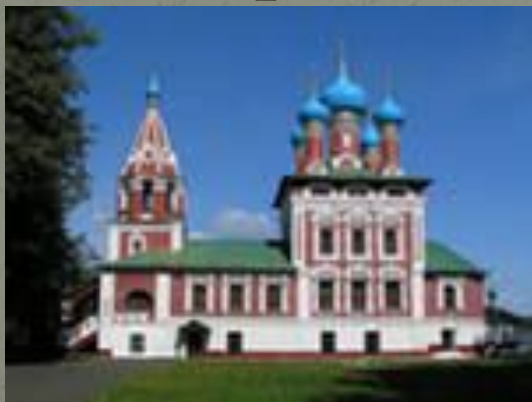
«церковь царевича Дмитрия на крови»

В Угличе, на месте убиения святого царевича Дмитрия, был построен храм его имени, который в народе получил название «церковь царевича Дмитрия на крови».