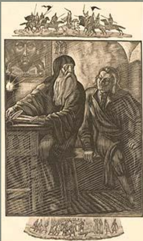
В.А.Фаворский. «Борис Годунов». Фронтиспис к неосуществленному изданию. 1940 г. Бумага, гравюра на дереве.