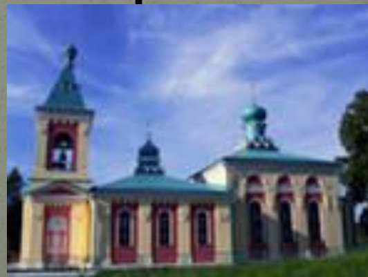
храм Преображения Господня.