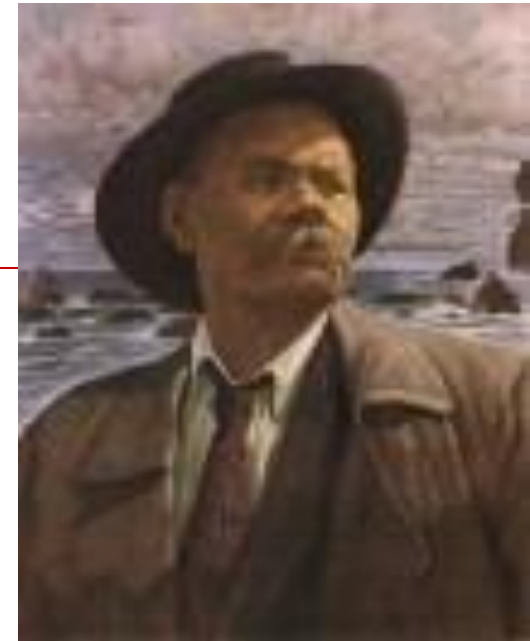
Бродский И.И. 1937

Любите книгу, она облегчит вам жизнь....она научит вас уважать человека и самих себя, она окрыляет ум и сердце чувством любви к миру, к человеку.