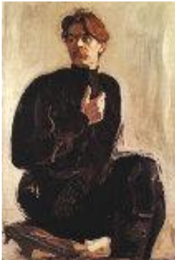
Портрет Горького работы В. Серова 1905г.