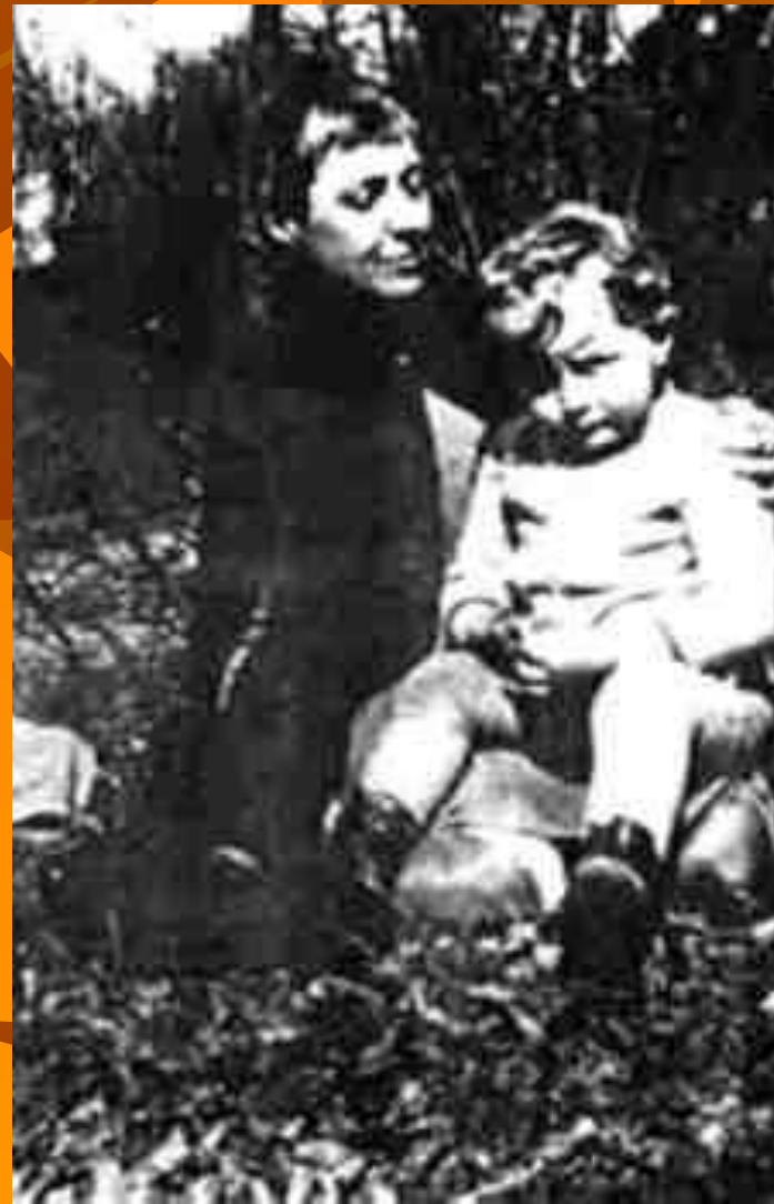
М.Цветаева с сыном