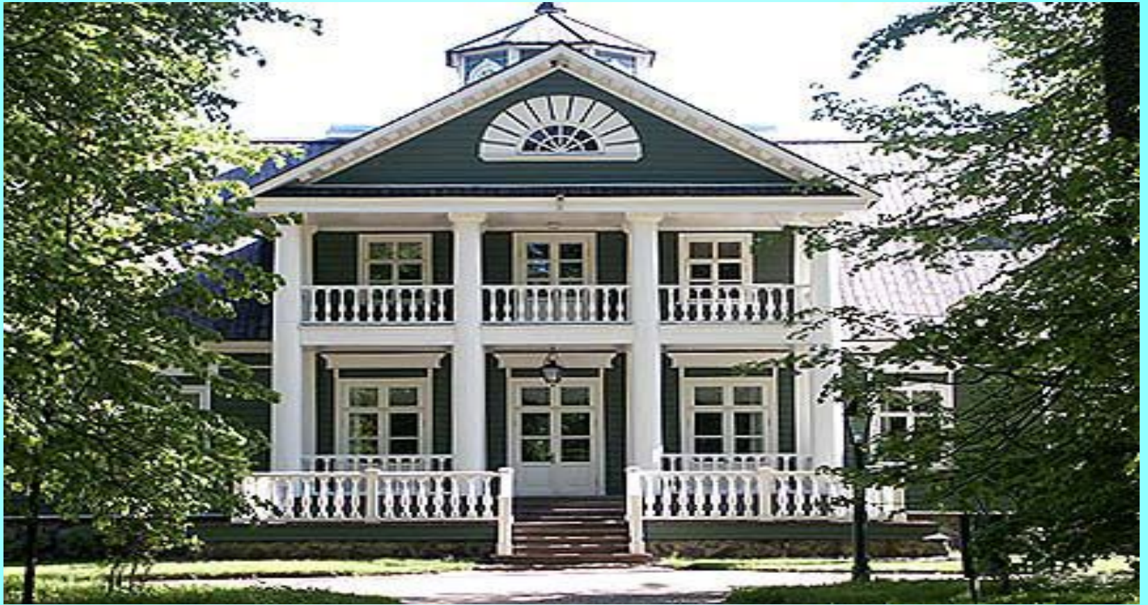
Петровское. Большой господский дом («дом П.А. Ганнибала»).