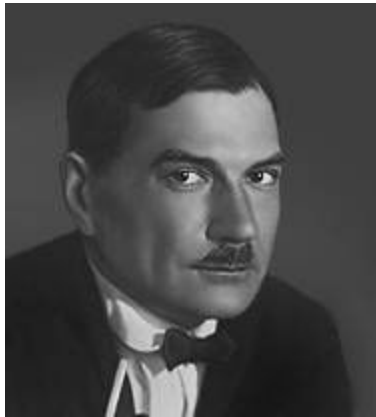
Е. И. Замятин