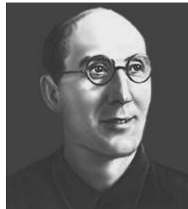
С. М. Третьяков