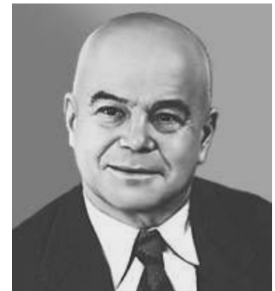
В. Б. Шкловский