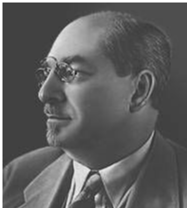
А. В. Луначарский