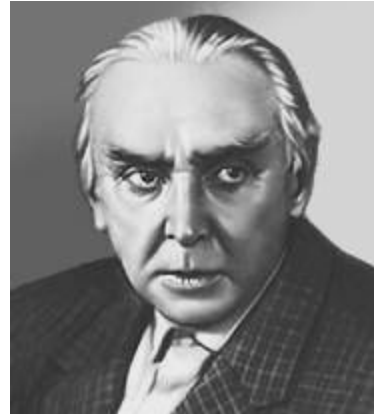
К. А. Федин