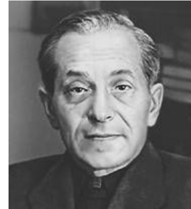
М. М. Зощенко