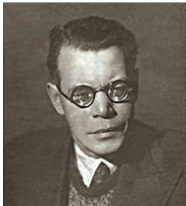
М. В. Исаковский