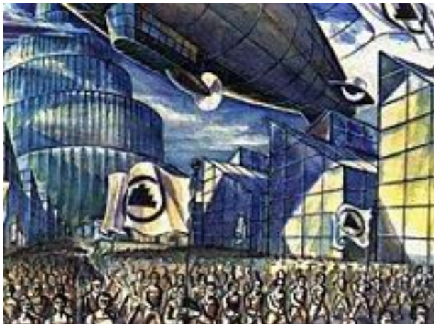
Иллюстрация к роману Е. И. Замятина «Мы»

Господствующая эстетическая идея сменовеховцев – «свобода творчества»