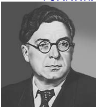
И. Л. Сельвинский

«...Лефы первые начали индустриальное обновление всяческого реквизита искусства, пытаюсь связать проблемы искусства с задачами промышленной техники и быта Советской России»