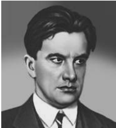
В. В. Маяковский

«Человек для нас ценен не тем, что он переживает, а тем что он делает»