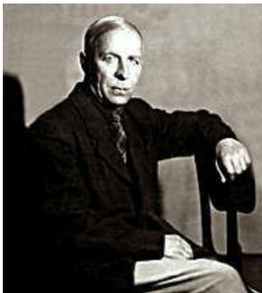
Н. Н. Асеев

И я увидел в расступившихся днях- в глазах его, грозных и синих,- проросший сквозь нэп строевой молодняк, не только – осенний осинник.