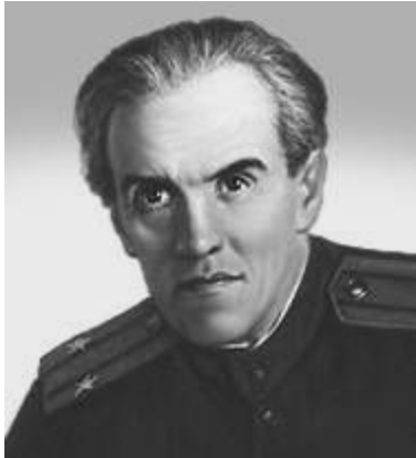
Н. С. Тихонов