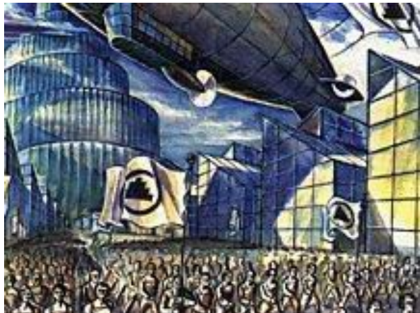
Иллюстрация к роману Е. И. Замятина «Мы»

Господствующая эстетическая идея сменовеховцев – «свобода творчества»