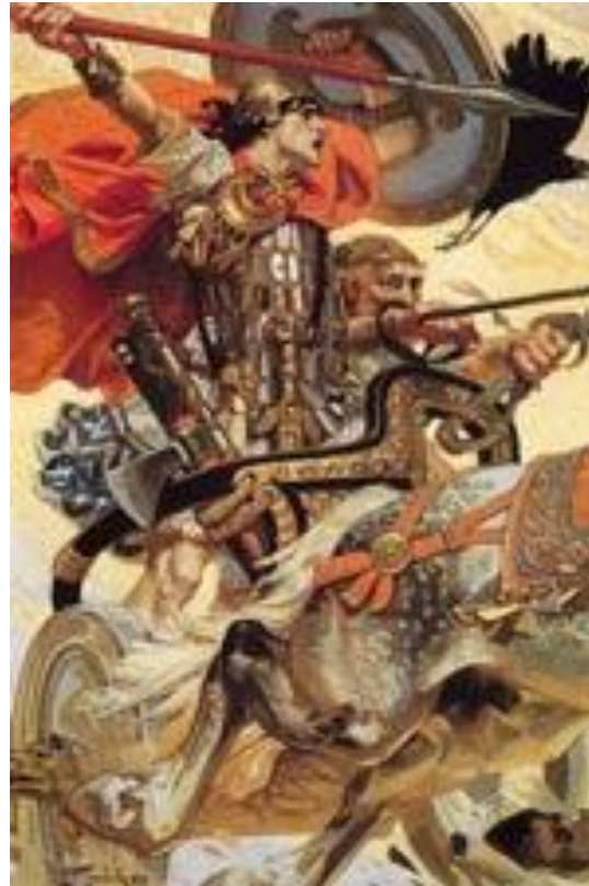
Дж. Лейендеккер • «Кухулин в бою»