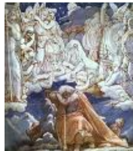
Ж. Д. Энгр «Финн Мак –Кумхайл»