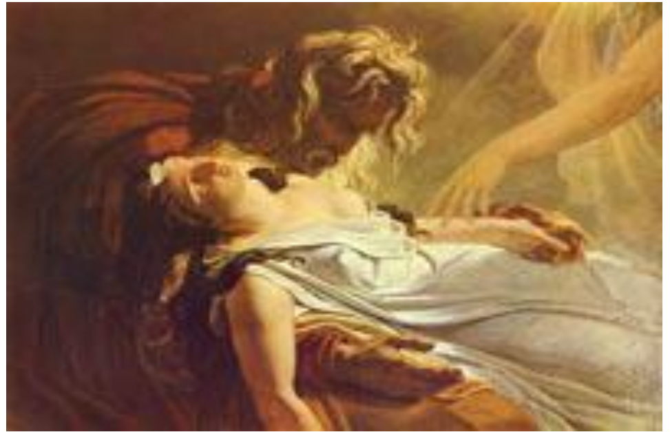
Энн Луис Жеродо «Смерть жены Финна»