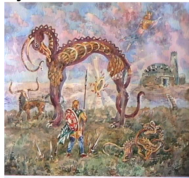
«Путь к замку Скатах»