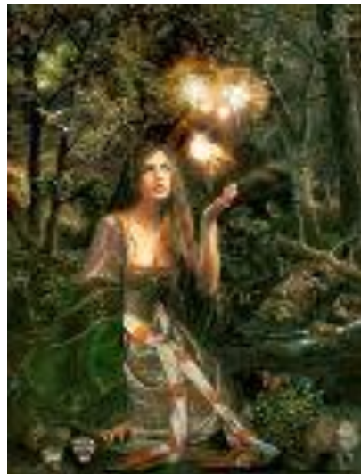
Говард Джонсон «Превращение Садб»