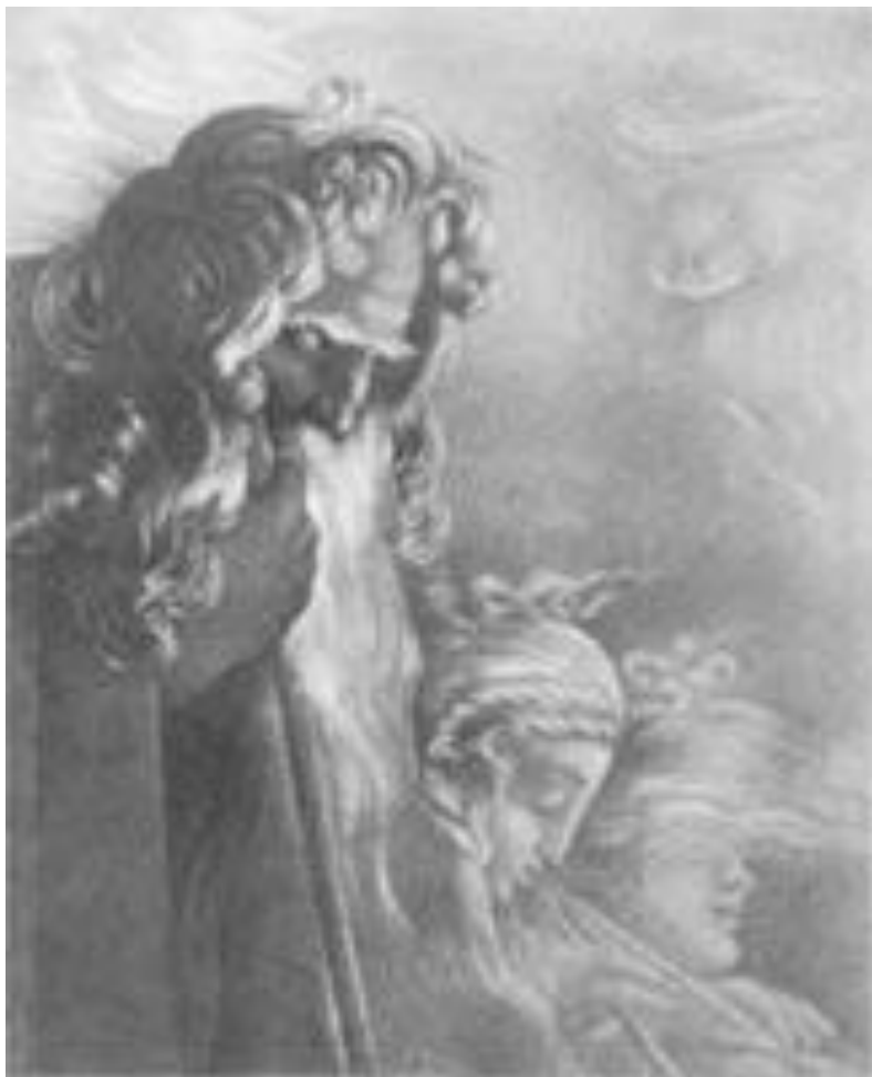
Литография Тончи «Оссиан»