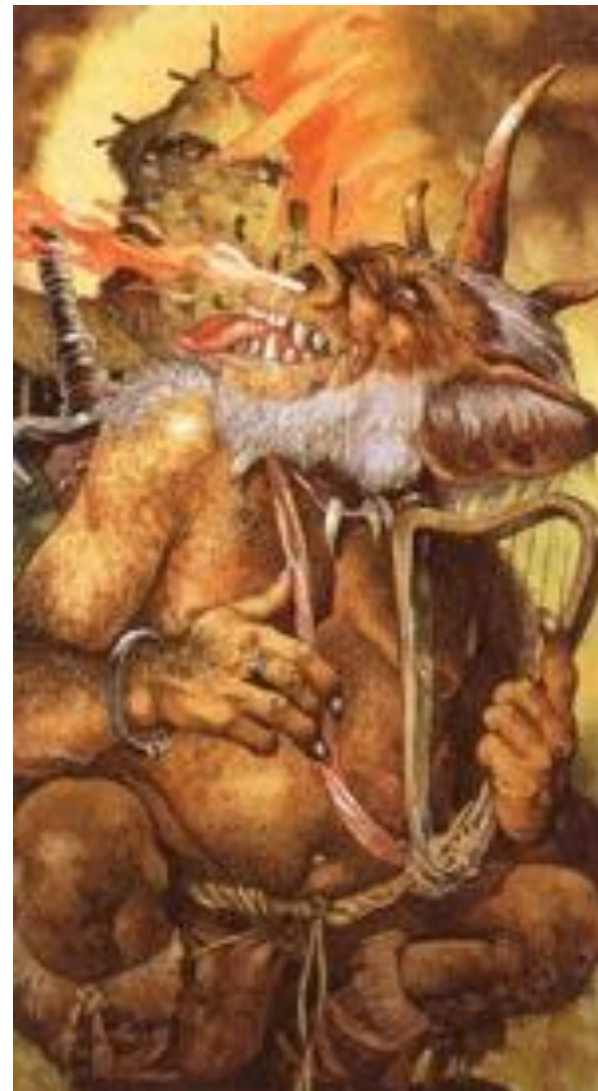
Гиасинто Гаудензи «Айлен Мак Мидна»