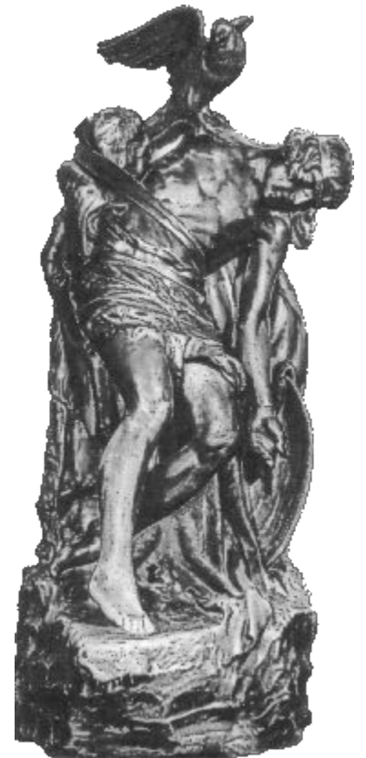
Дублин. Скульптура «Умирающий Кухулин»