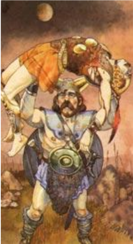
Г. Гаудензи «Кухулин»