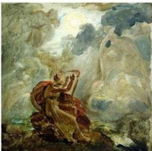
Ф. Жерард «Оссиан, вызывающий призраков»