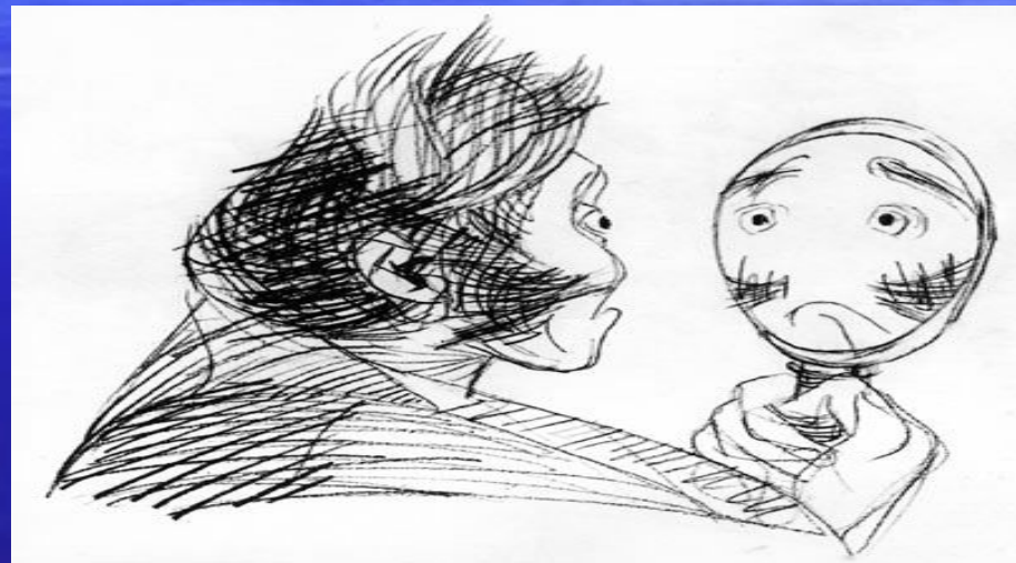
Коллежский асессор, майор Ковалев

В.Н.Горяев Карандаш, иллюстрации 1963-1965