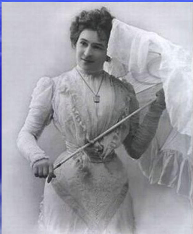
О.Л. Книппер, жена Чехова