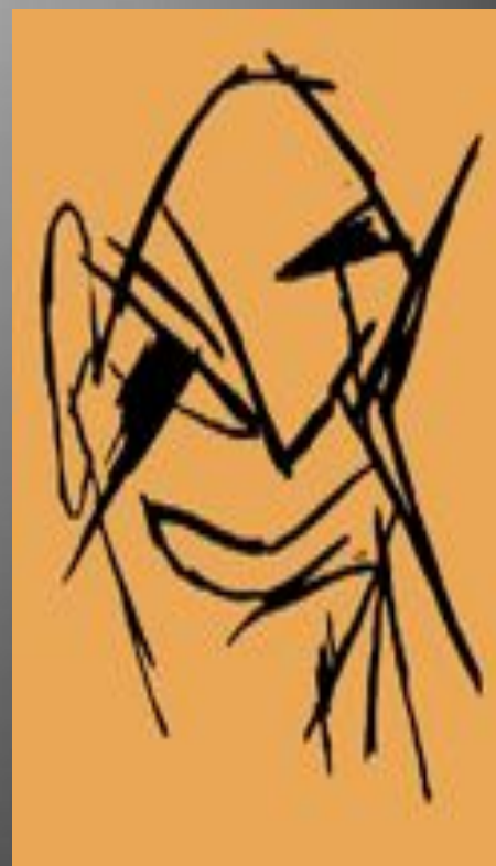
М.Ларионов Портрет А.Кручёных