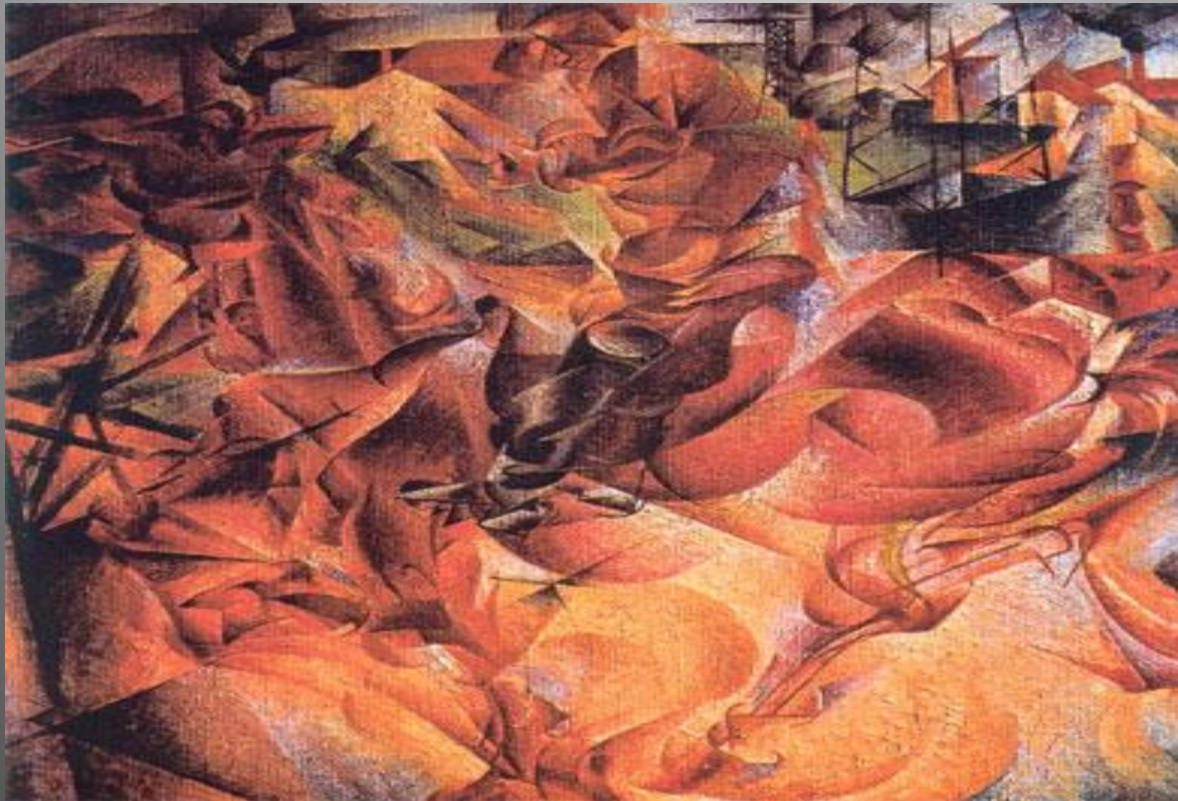
Умберто Боччони «Эластичность» 1912г.

Футуризм исходил из восхищения к технической цивилизации. Художники изображали сюжеты из производственного процесса, движение, скорость, технические формы машин. Спокойная и статистическая форма делилась на фазы. Стремление «симультанно» подхватить несколько действий, происходящих одновременно ( Балла, Кара, Северини, Боччони)