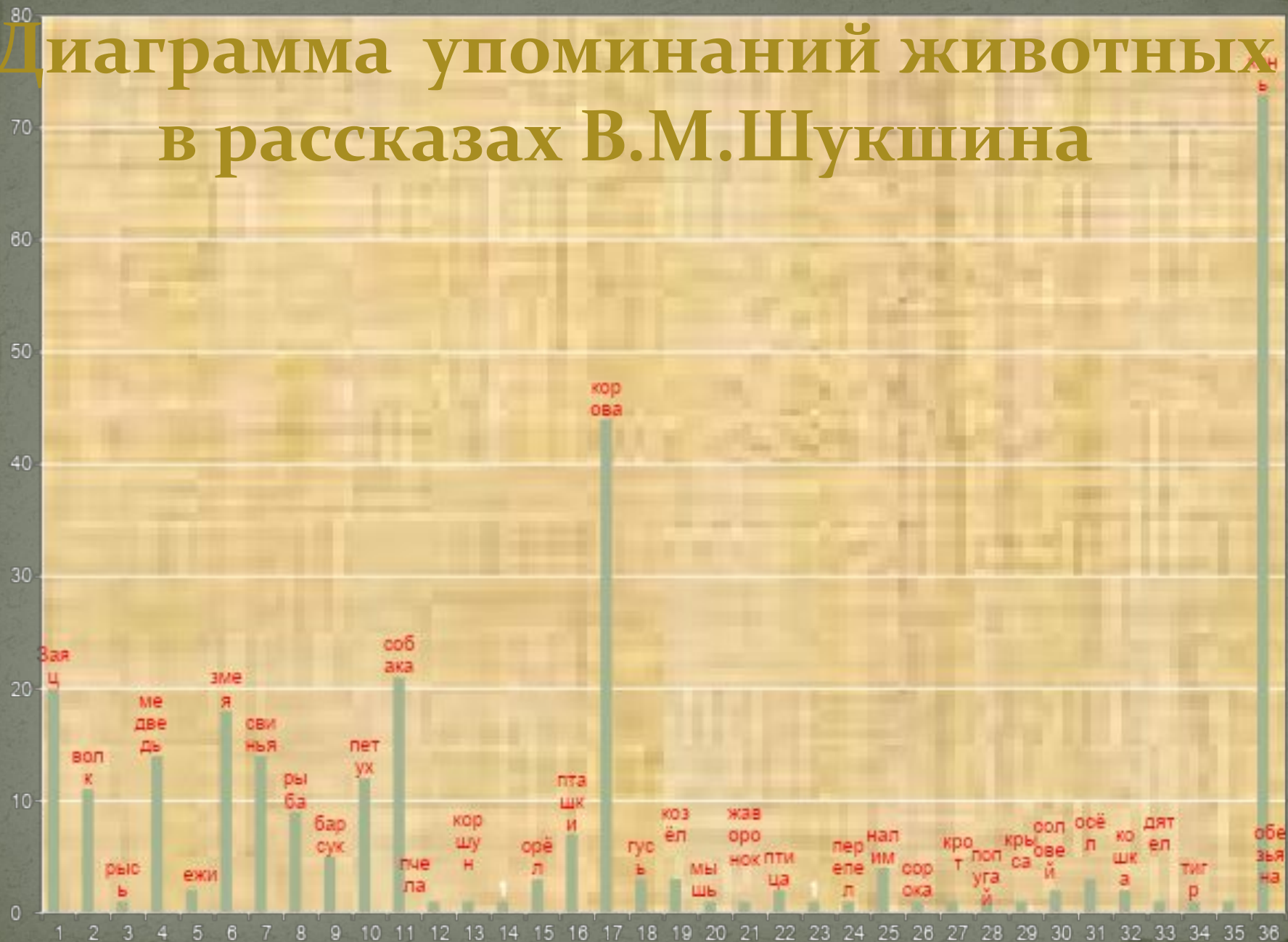
Диаграмма упоминаний животных в рассказах В.М.Шукшина