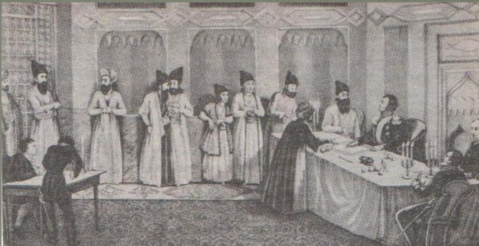
Заклучение Туркманчанского договора после войны между Россией и Турцией 1828-1829гг. (Справа, у торца стола, сидит Грибоедов)

Грибоедов назначен полномочным министром в Тегеран. Это была «политическая ссылка».