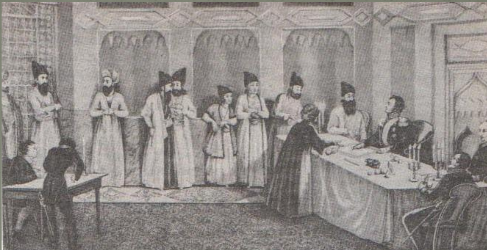
Заклучение Туркманчанского договора после войны между Россией и Турцией 1828-1829гг. (Справа, у торца стола, сидит Грибоедов)

Грибоедов назначен полномочным министром в Тегеран. Это была «политическая ссылка».