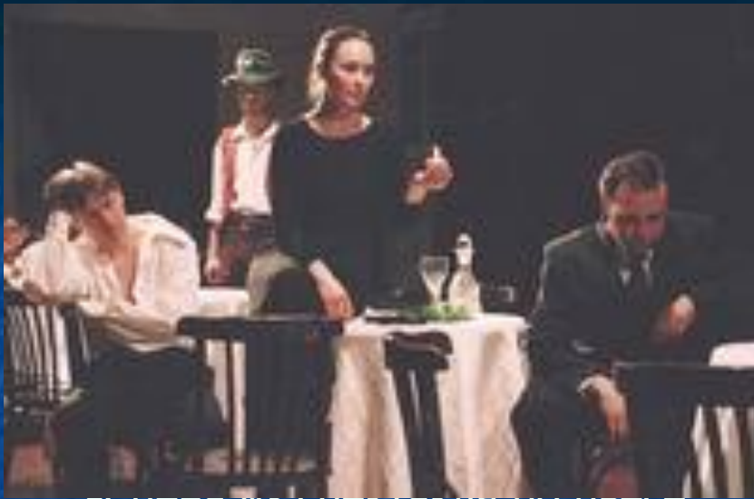
• Сцена из спектакля по пьесе «Бесприданница».