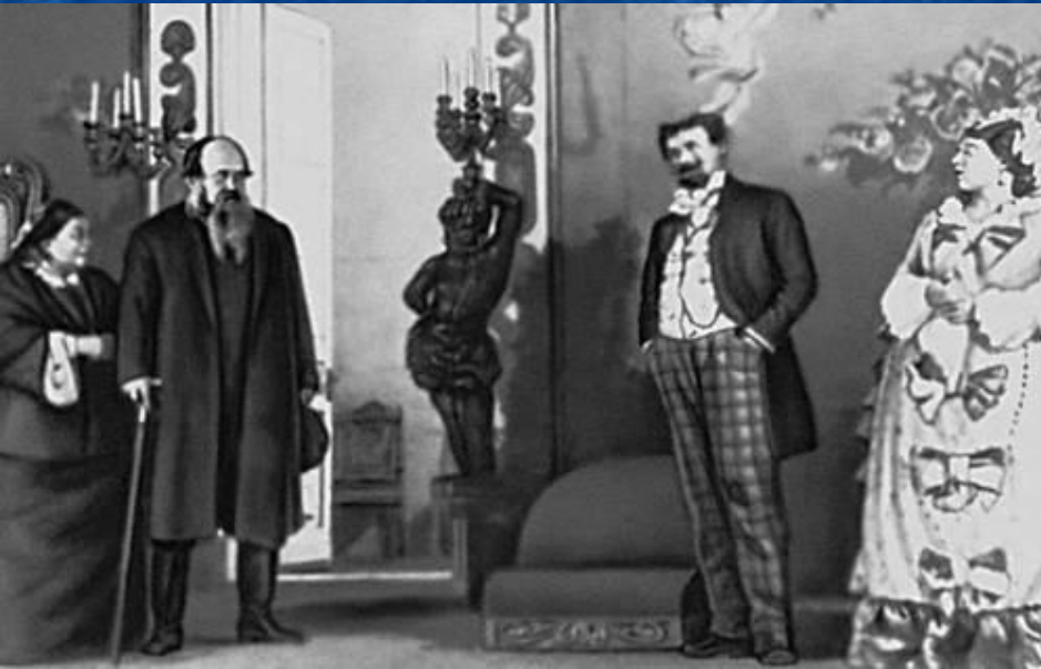
«Свои люди – сочтёмся!». Сцена из спектакля.