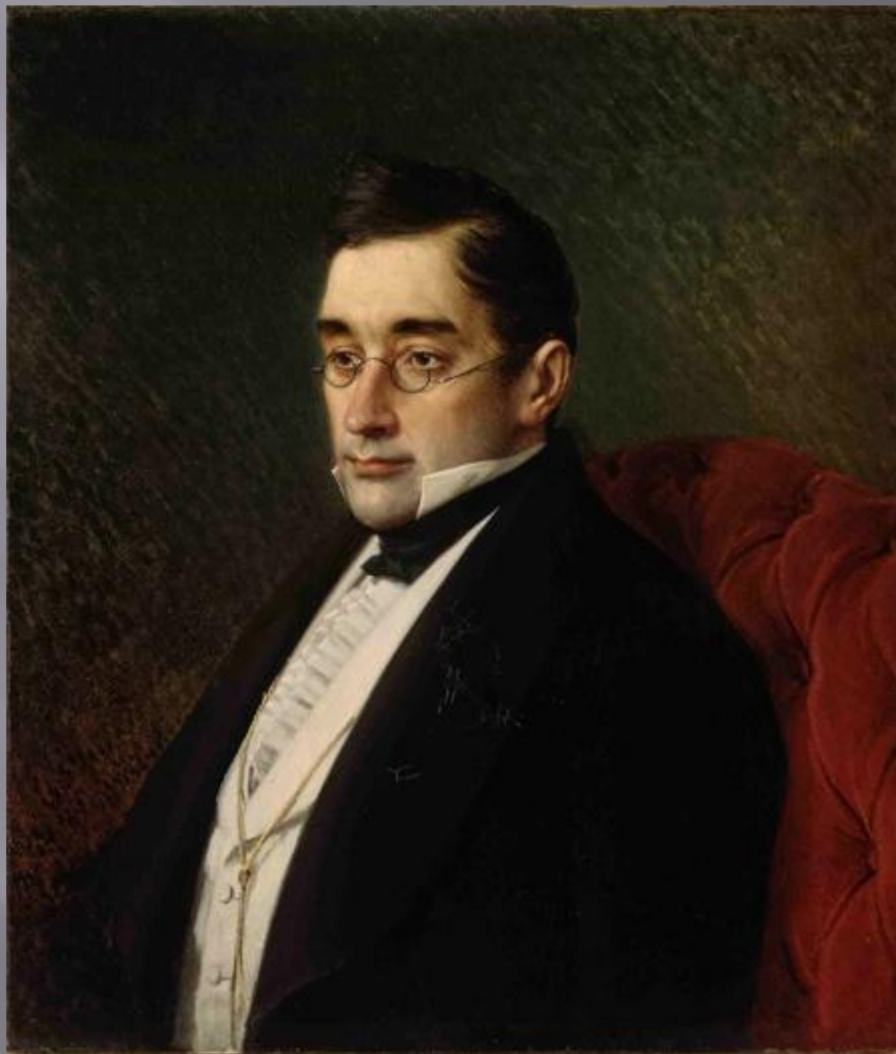
А.С.Грибоедов: жизнь и судьба