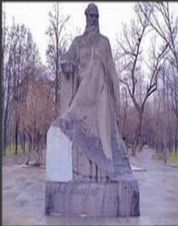
Памятник Толстому в сквере Девичьего поля