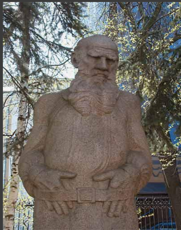
Памятник Толстому у Государственного музея Л. Н. Толстого