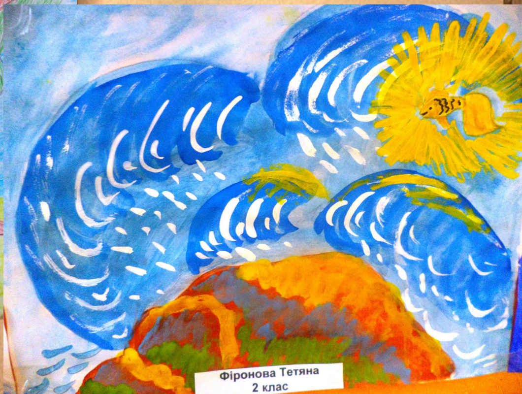
Фіронова Тетяна 2 клас