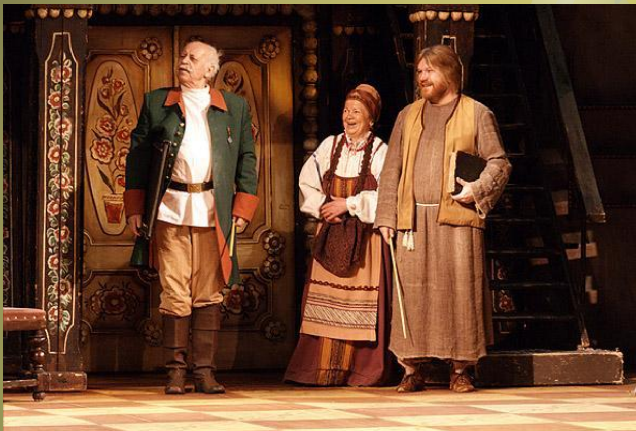
Кутейкин в комедии «Недоросль»

Пьеса Фонвизина « Недоросль », написанная в 1782 году, является самым известным его произведением и самой репертуарной пьесой XVIII века на русской сцене последующих веков. Это первая в истории русской драматургии социально-политическая комедия. Автор изобличает в ней пороки современного ему общества.