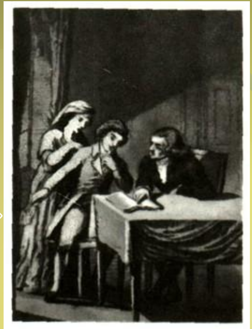
Митрофан в комедии «Недоросль»

им даны «говорящие имена» Простаковы, Скотинины, Митрофан – «проявление матери» по-гречески, Стародум, Милон, Правдин, Софья — «мудрость» по-гречески, Цыфиркин, Вральман, Кутейкин.