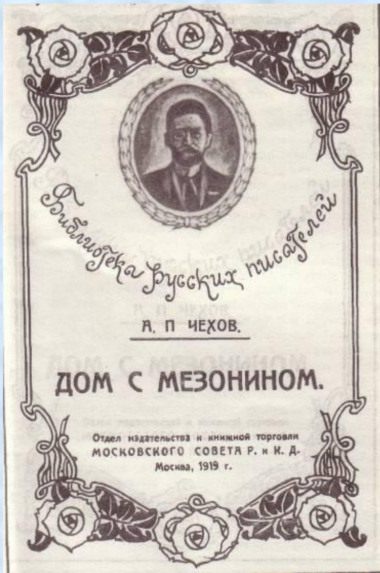
Обложка повести А.П.Чехова «Дом с мезонином». Москва, 1919, ГПБ