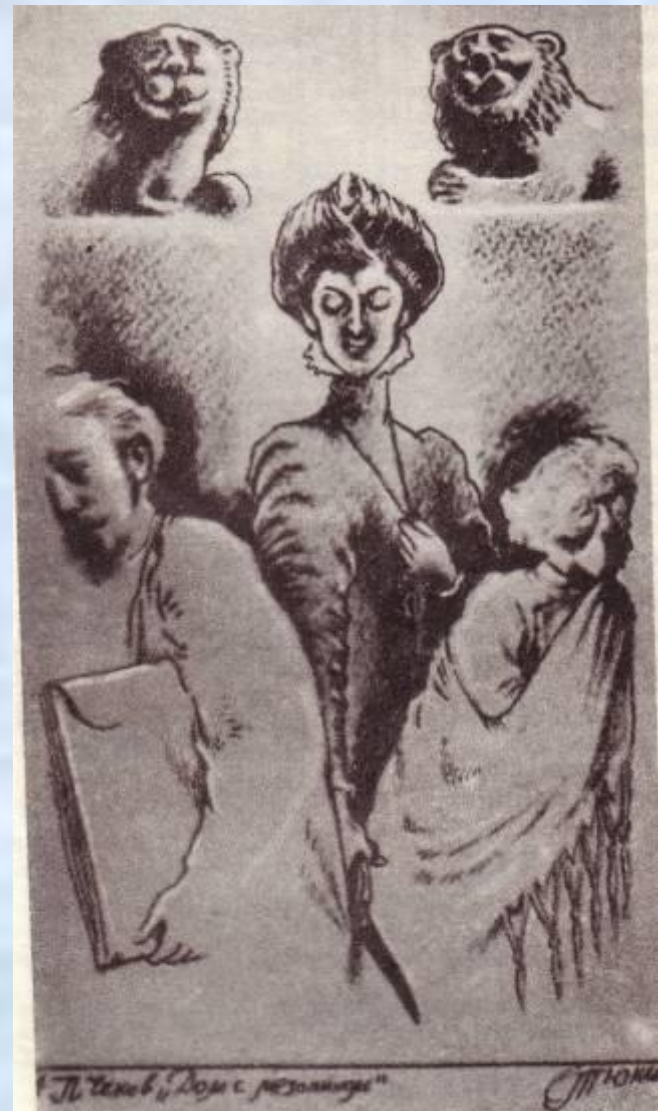
Тюнин С. Иллюстрация к повести А.П.Чехова «Дом с мезонином»