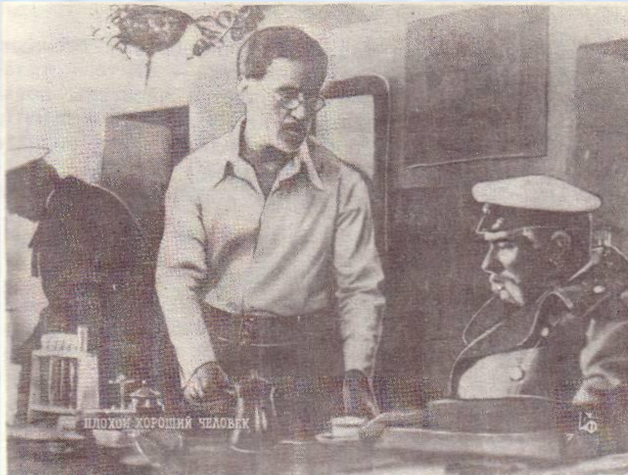
Кадр из кинофильма «Плохой хороший человек» Мосфильм. В роли фон Корена В.Высоцкий.