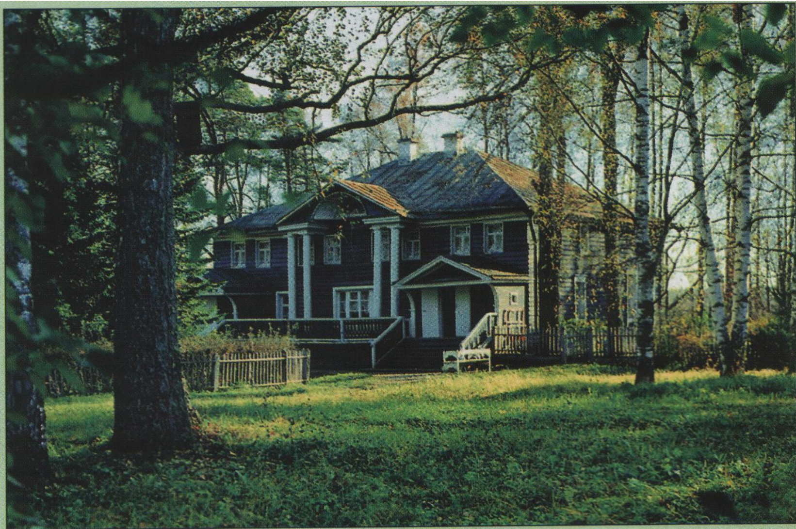
Щельково - костромская усадьба Островского