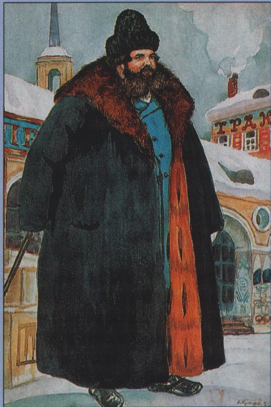
Ф. М. Кустодиев. Купцы в шубе. 1920