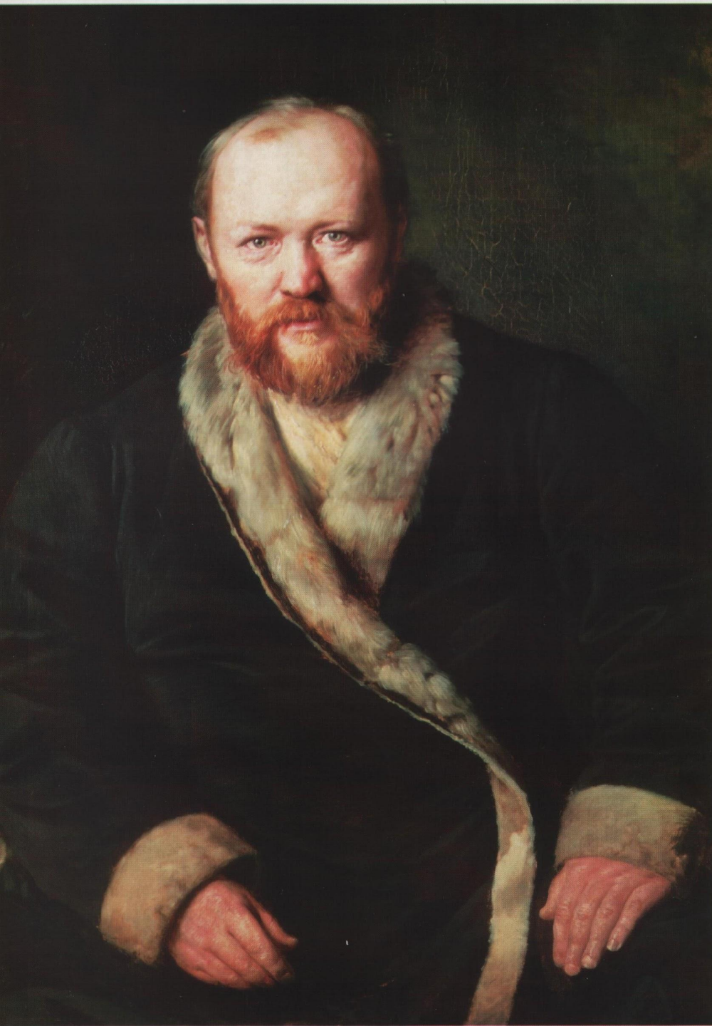
Александр Николаевич Островский (1823-1886гг.)