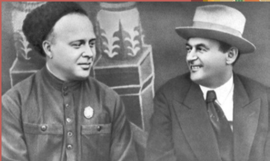
Р. Фраерман с А. Гайдаром