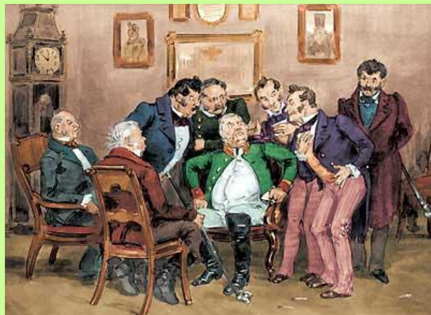
Чиновники обсуждают письмо Хлестакова