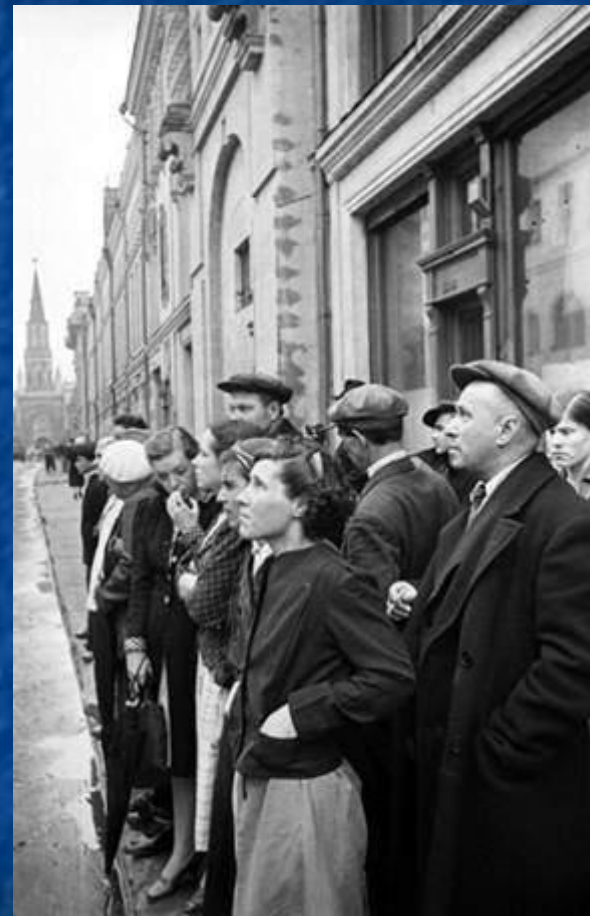
Москва. 22 июня 1941 г.

Бороться с врагом призывали поэтесса Серебряного века Анна Ахматова и крестьянский сын Александр Твардовский.