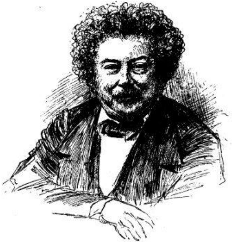
Alexandre Dumas père.