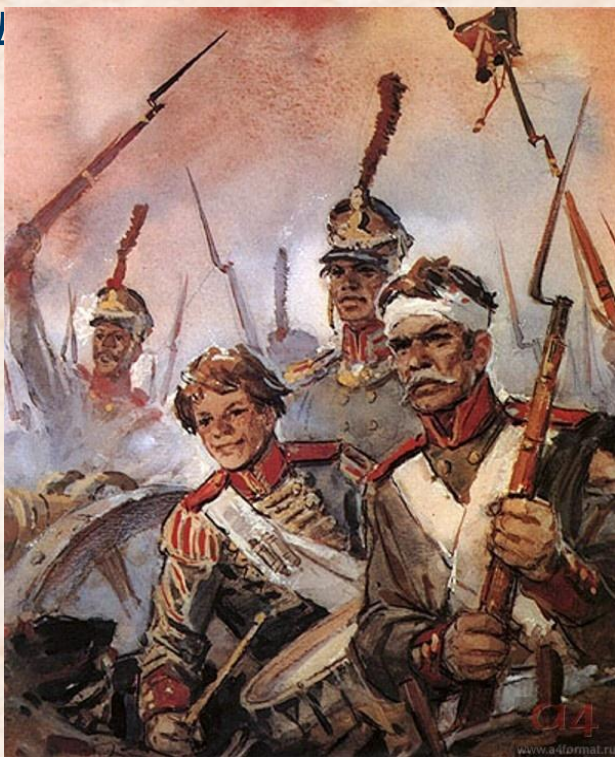
Герои Бородинской битвы

Афанасий Столыпин – брат бабушки поэта, участник войны 1812 года, артиллерист- «бородинец». Он когда-то живо и образно поведал М.Ю.Лермонтову о ходе великой битвы. Еще в юношеском стихотворении «Поле Бородина» Лермонтов выразил восхищение подвигом русских воинов. Многие мотивы этого произведения были позднее переосмыслены и вошли в окончательный вариант «Бород