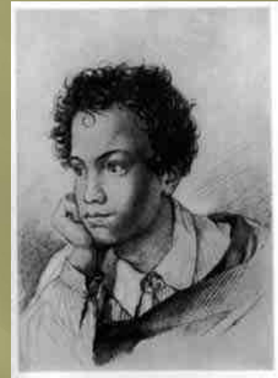
А. С. Пушкин - ученик

Но из всех предметов Саша так и не полюбил арифметику.