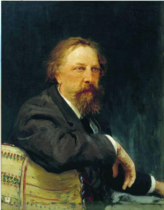
А.К.Толстой Худ. И.Репин, 1879 г.

русский писатель, поэт, драматург, член-корреспондент Петербургской АН (1873), граф.