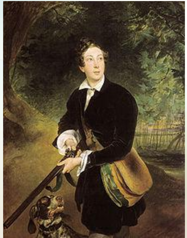
К. П. Брюллов. Портрет Алексея Толстого в юности (1836)

«Я один из двух или трех писателей, которые держат у нас знамя искусства для искусства, ибо убеждение мое состоит в том, что назначение поэта - не приносить людям какую-нибудь непосредственную выгоду или пользу, но возвышать их моральный уровень, внушая им любовь к прекрасному».