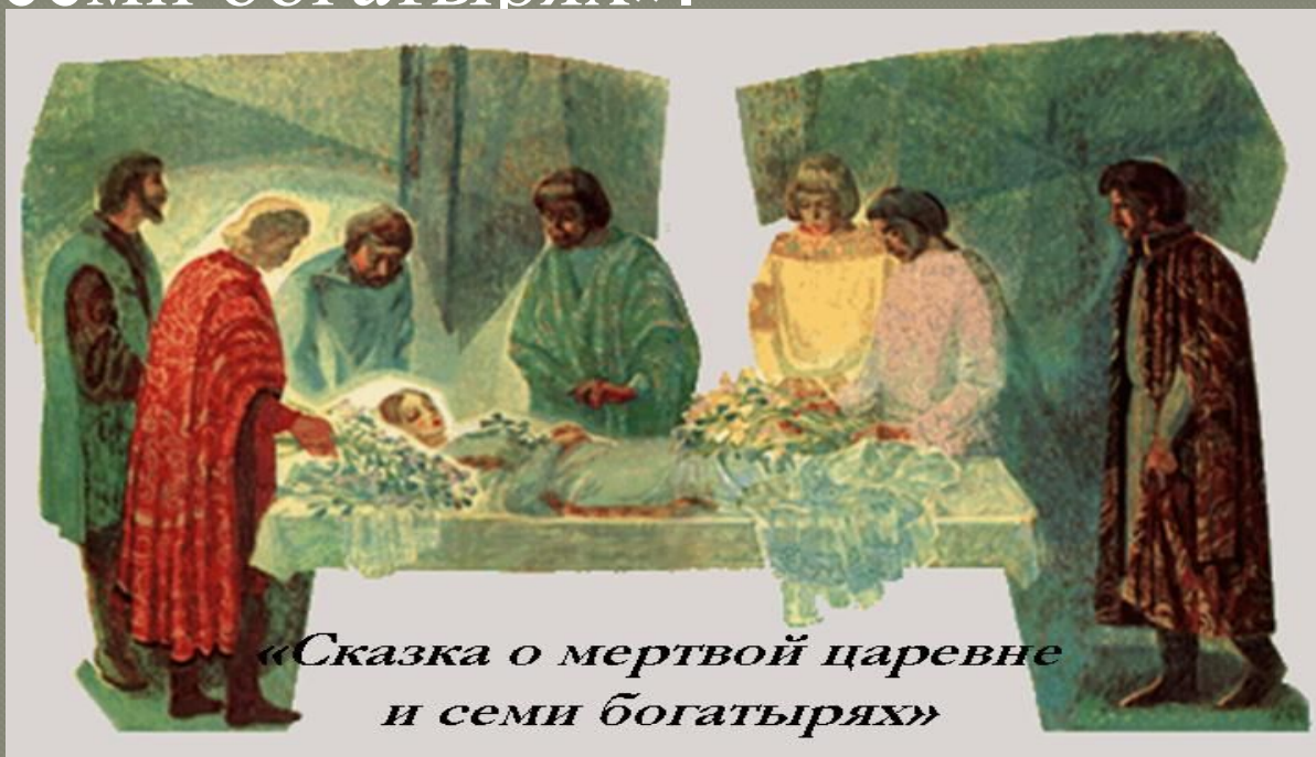
«Сказка о мертвой царевне и семи богатырях»