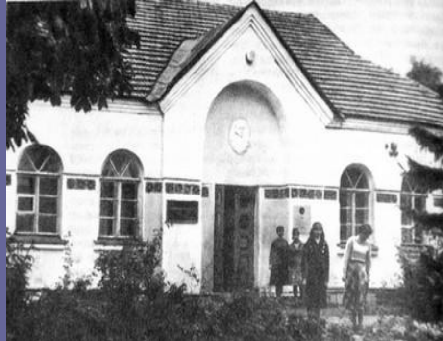
Музей Гоголя в Сорочинцах