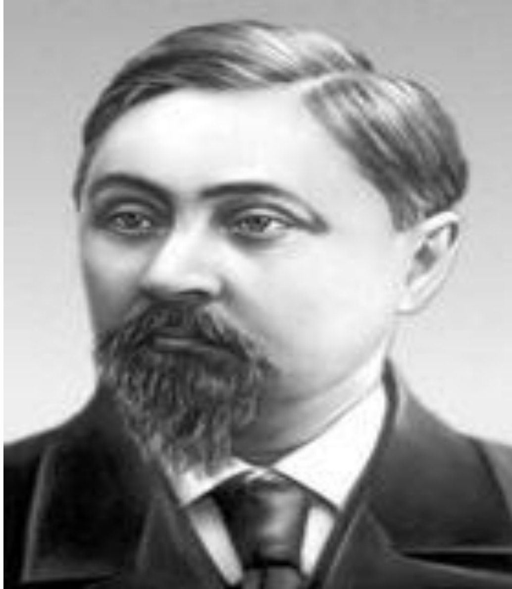
Дмитрий Наркисович Мамин – Сибиряк