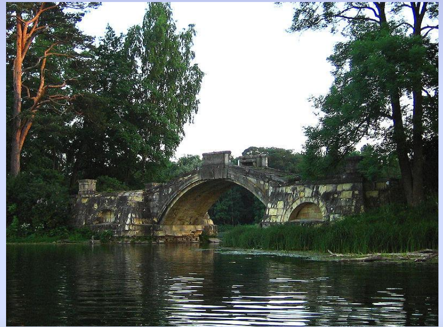
Горбатый мост. 1800.