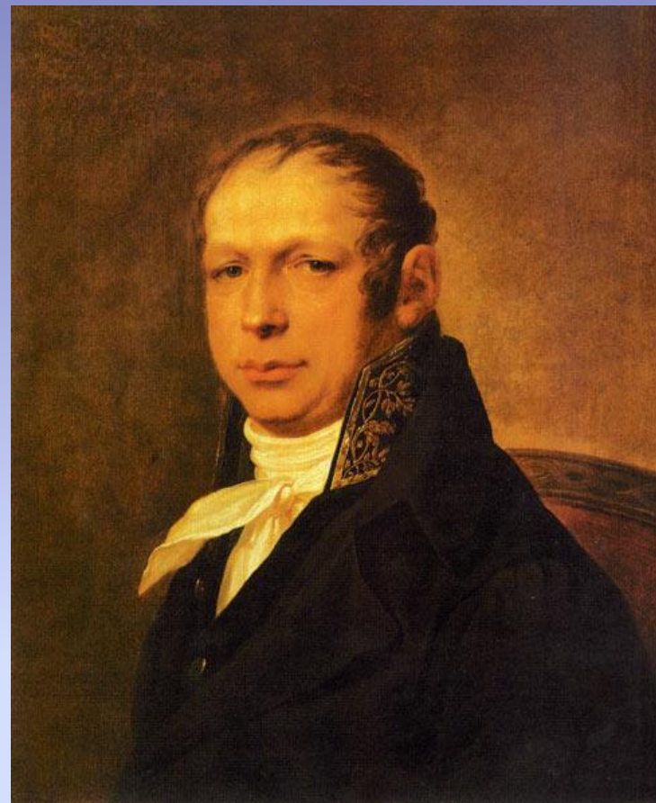
Портрет работы С. С. Щукина. Около 1804 года.

Андреян Дмитриевич Захаров - русский архитектор, представитель стиля ампир. Создатель комплекса зданий Адмиралтейства в Санкт-Петербурге.