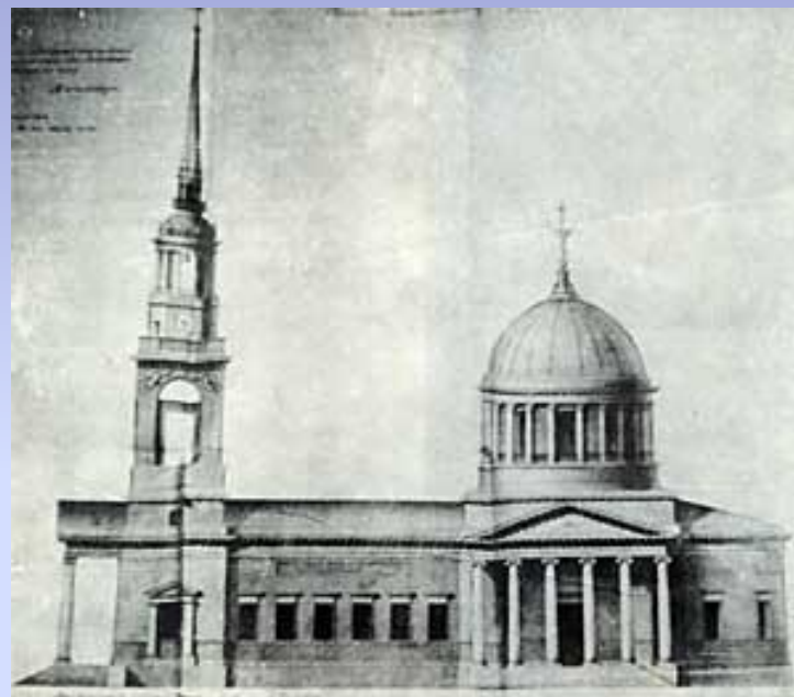
Проект Андреевского собора архитектора А.Д.Захарова. 1806 г.