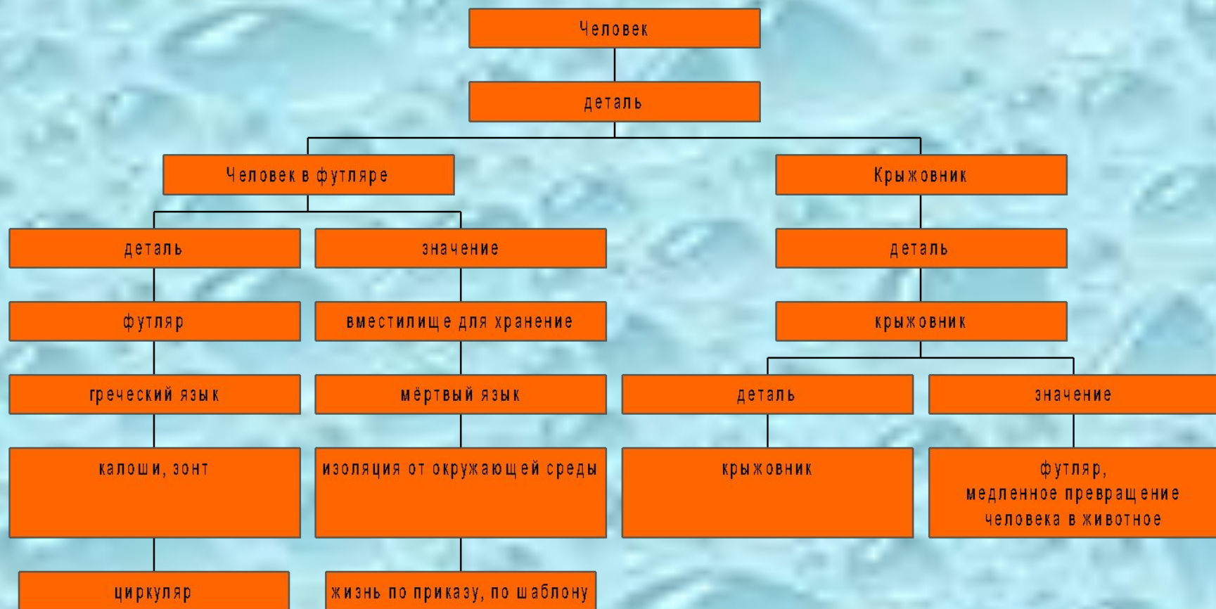
Схема деталей в трилогии Чехова