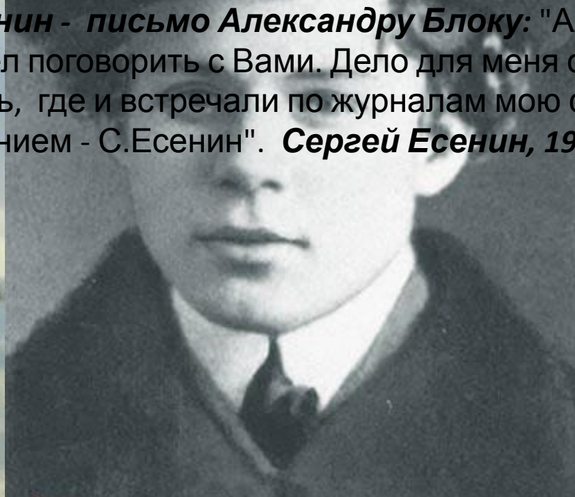
Есенин в возрасте 18 лет

Москва. Сергей Есенин - письмо Александру Блоку: "Александр Александрович! Я хотел поговорить с Вами. Дело для меня очень важное. Вы меня не знаете, а может быть, где и встречали по журналам мою фамилию. Хотел бы зайти часа в 4. С почтением - С.Есенин". Сергей Есенин, 19 лет - 9 марта 1915. Петроград.