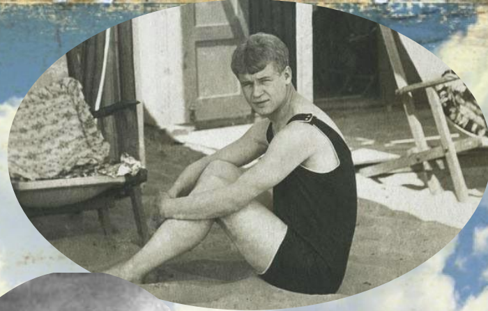
Сергей Есенин. Венеция, Лидо. Фото - 14 августа 1922 год.