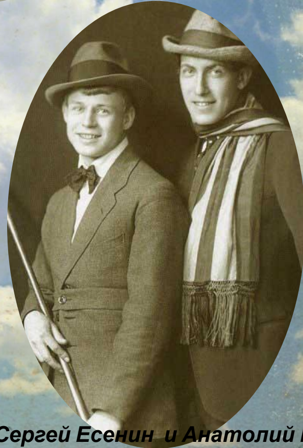
Сергей Есенин и Анатолий Москва, лето. Фото - 1919 год.