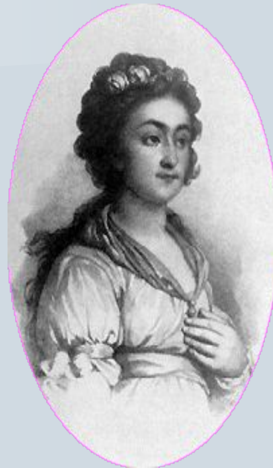
Первая жена Г.Р Державина Екатерина Яковлевна Бастидон (1760-1794)

Конфликт с Вяземским, скрывавшим государственные доходы, привел к отставке Державина с сенатской службы, но с 1784 г. по воле Екатерины II он назначается губернатором Олонецкого края. Борьба за законность с наместником генерал-губернатором Тутолминым закончилась поражением Державина, и года не пробывшего на этом посту. Последовало новое назначение - тамбовским губернатором. Державин успел много сделать для просвещения Тамбовского края, но попытки отстаивать справедливость и нежелание "ладить" с высшими вельможами привели к смещению с должности в 1788 г. За годы, проведенные на губернаторстве, поэтическая слава Г.Р.Державина возросла.