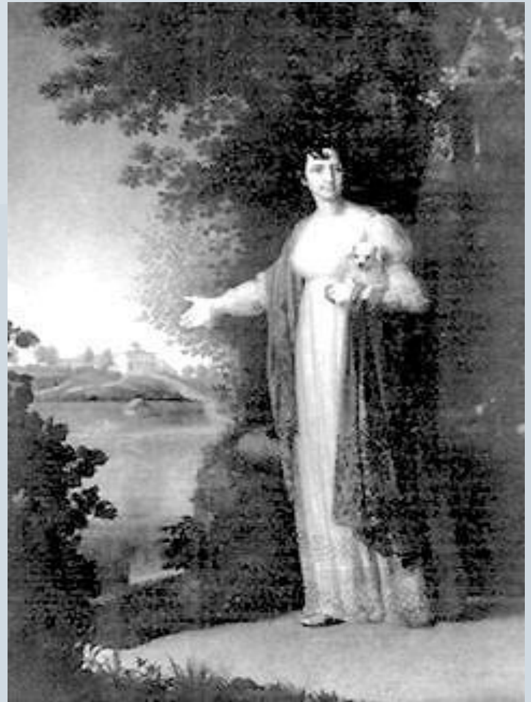
Дарья Алексеевна Дьякова (1767-1842), жена Г.Р.Державина

В 1794 г. умерла жена Державина, Екатерина Яковлевна. В 1795 г. Гаврила Романович женился второй раз, на Дарье Алексеевне Дьяковой (1767-1842). На сестрах Дьяковой - Александре и Марии - были женаты два других поэта того времени, Василий Васильевич Капнист и Николай Александрович Львов, с которыми Державина связывали не только родственные отношения, но и дружба.