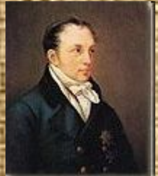
Егор Антонович Энгельгардт. С марта 1816 — директор Лицея.

И первую полней, друзья, полней! И всю до дна в честь нашего союза! Благослови, ликующая муза, Благослови: да здравствует лицей! Наставникам, хранившим юность нашу, Всем честью, и мертвым и живым, К устам подъяв признательную чашу, Не помня зла, за благо воздадим.