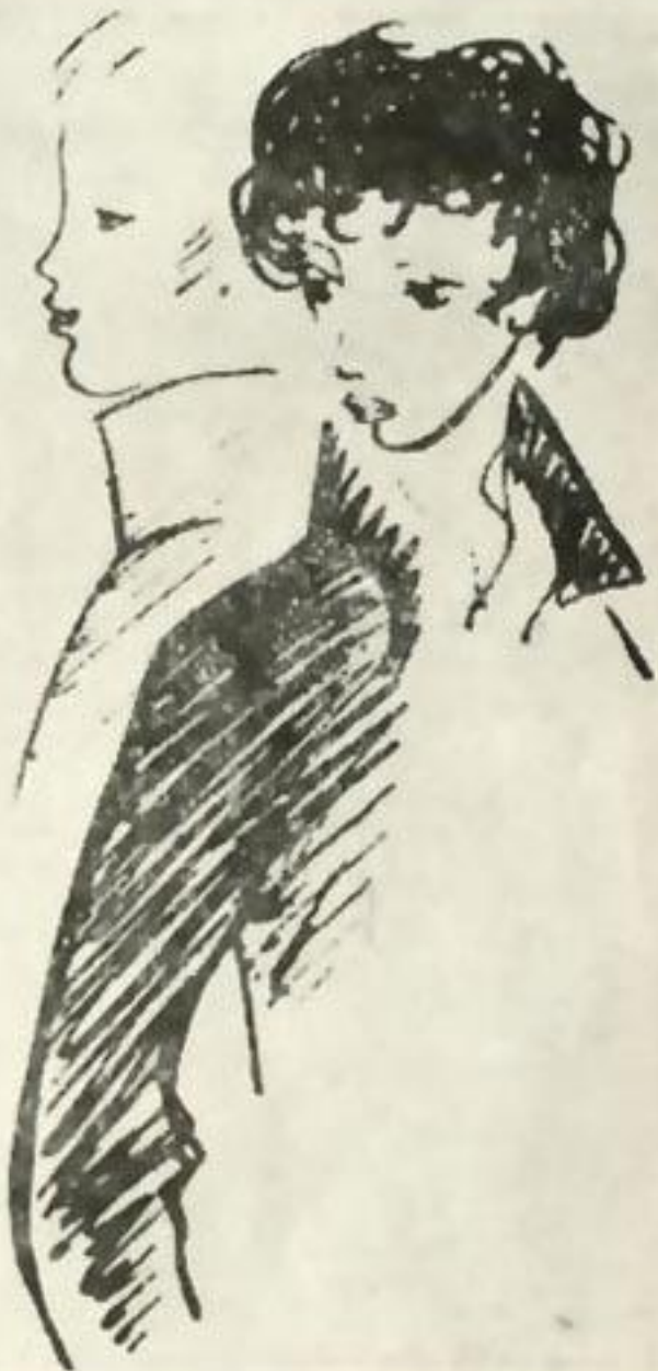
Рисунок Н. Рушевой

Дай руку, Дельвиг, что ты спишь? Проснись, ленивец сонный! Ты не под кафедрой лежишь, Латынью усыпленный. Писатель, за свои грехи Ты с виду всех трезвее; Вильгельм, прочти свои стихи, Чтоб мне заснуть скорее!