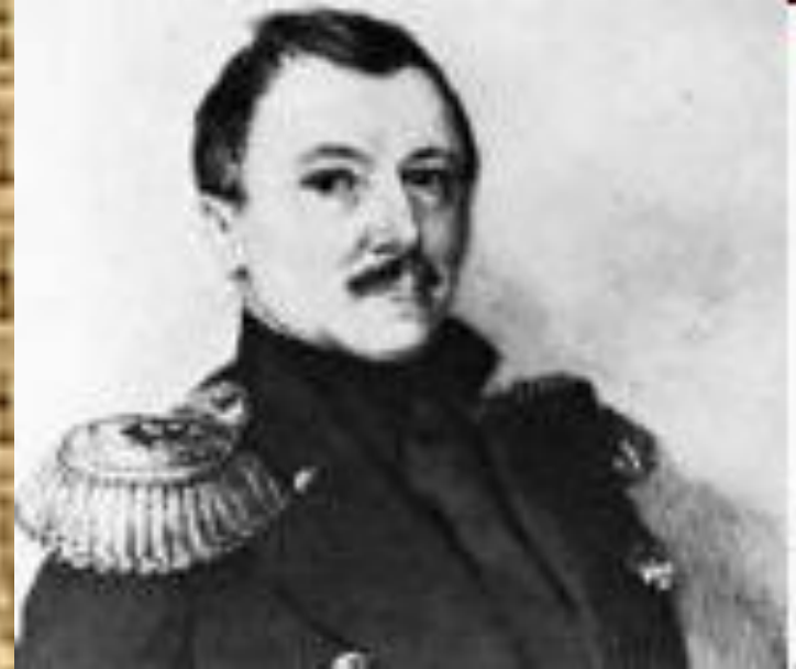
МАТЮШКИН Федор Федорович

Ты сохранил в блуждающей судьбе Прекрасных лет первоначальны нравы: Лицейский шум, лицейские забавы Средь бурных волн мечталися тебе; Ты простирал из-за моря нам руку, Ты нас одних в молодой душе носил И повторял: «На долгую разлуку Нас тайный рок, быть может, осудил!»