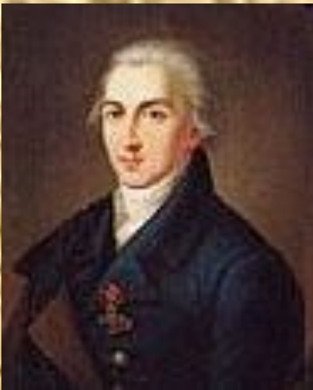
Василий Федорович Малиновский первый директор Царскосельского лицея