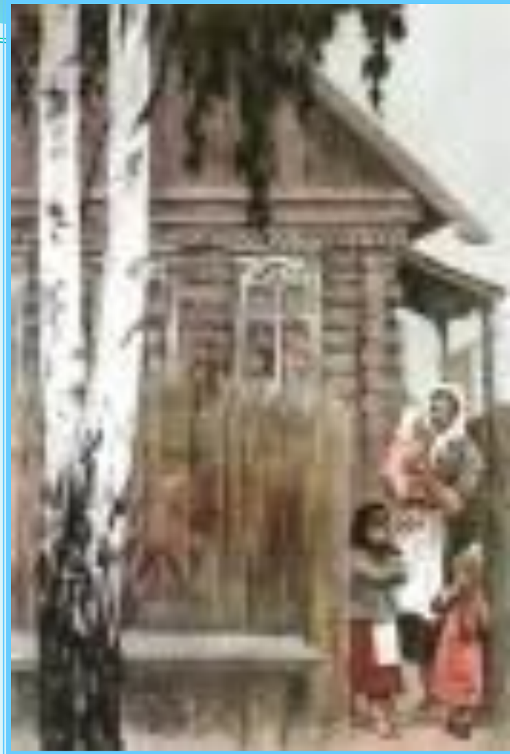
Иллюстрация к поэме «Дом у дороги». 📢