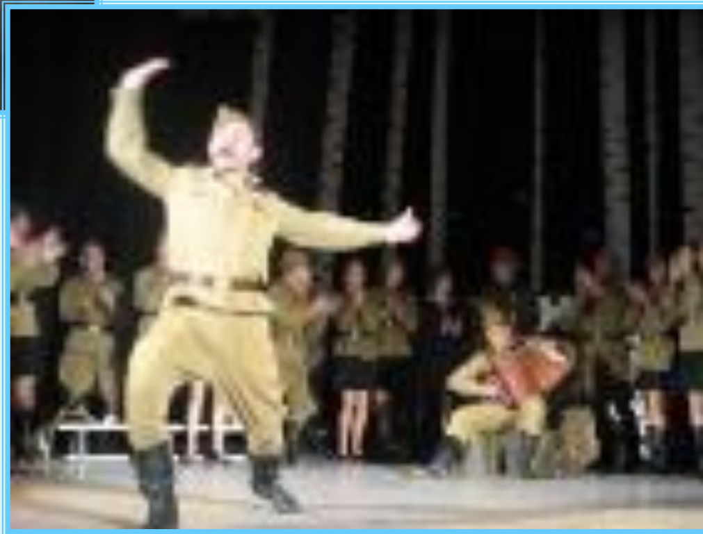
Сцены из спектакля «Василий Теркин»