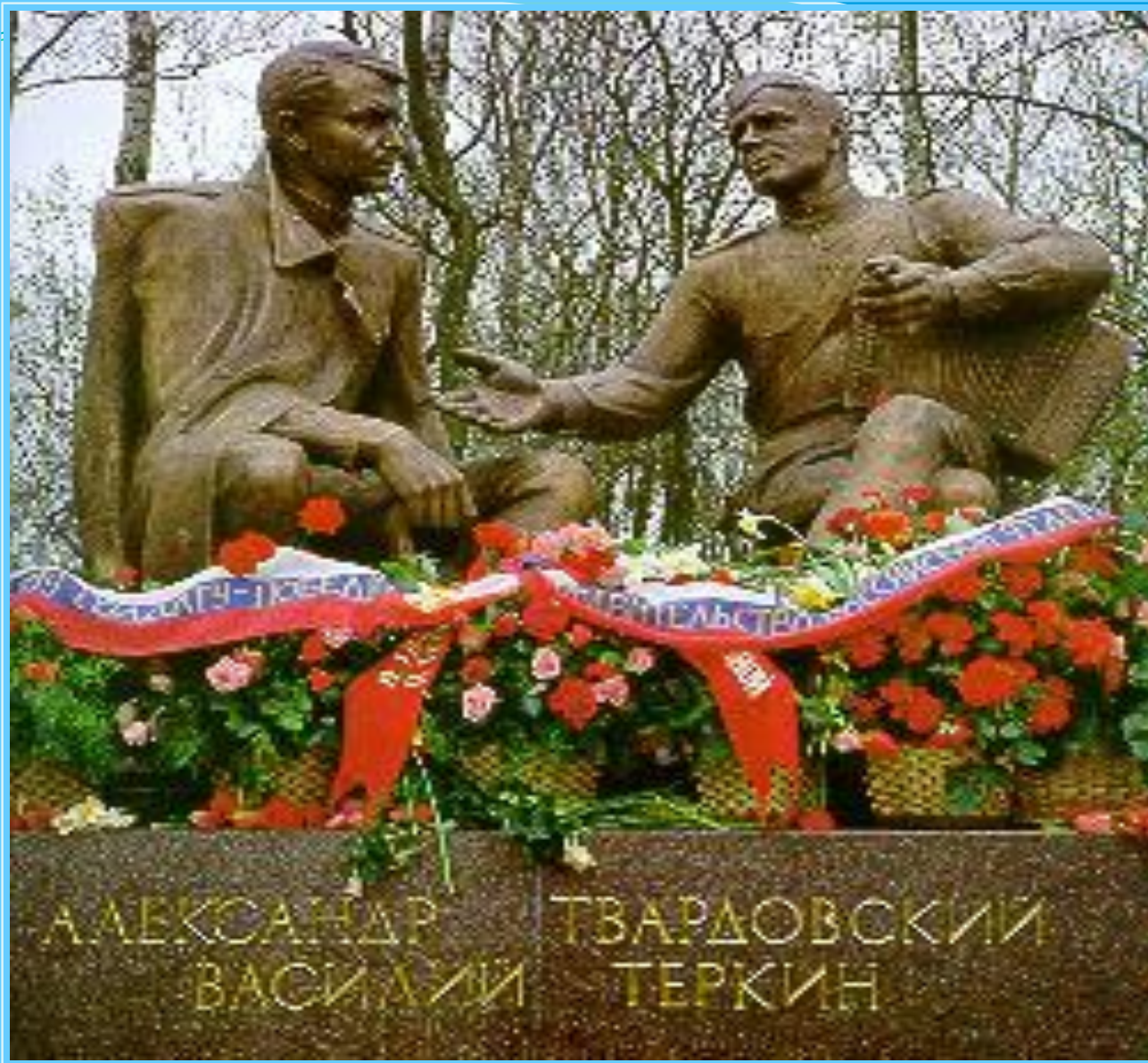
Памятник в г.Смоленске