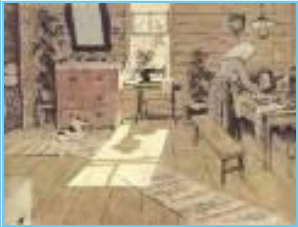
О.Вере́йский. К поэме «Дом у дороги».