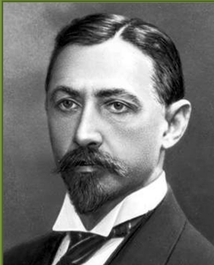
Иван Александрович БУНИН

«Литература», №06/2011 ИД "Первое сентября"